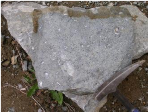
Phonolith aus dem Steinbruch Endhalen

Die dichten bis massigen Gesteine des Fohberges bei Bötzingen im Kaiserstuhl bestehen aus einem hellgrauen bis grauen, z. T. grünlich grauen, feinkörnigen, porphyrischen Phonolith mit Einsprenglingen. Die bis zu 2 mm großen Einsprenglinge setzen sich aus Ägirin-Augit, Melanit und seidenglänzenden, nadeligen Wollastonitkristallen zusammen. In der Grundmasse treten Alkalifeldspat und die Feldspatvertreter Hauyn, Sodalith und Nephelin auf. Während der autohydrothermalen Überprägung des Phonoliths wurde der ursprüngliche Mineralbestand, insbesondere die Feldspatvertreter , in Calcit, Epidot, Analcim und Zeolithe umgewandelt. Die Kristalle der Zeolithe liegen fein verteilt im Gestein vor bzw. haben sich auf Klüften angereichert. Der hohe Zeolithgehalt (s. u.) des Phonoliths ist der Grund für vielseitige Verwendungsmöglichkeiten des Gesteins, z. B. als Trassrohstoff . Als Trassrohstoff werden Gesteine bzw. Gesteinsmehle