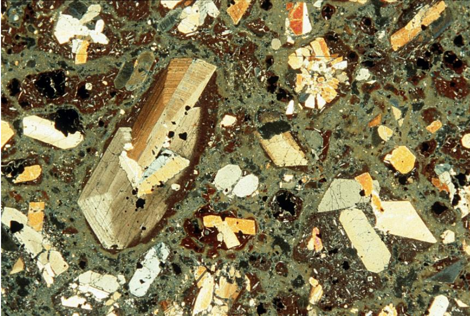
Dünnschliffbild eines Phonoliths