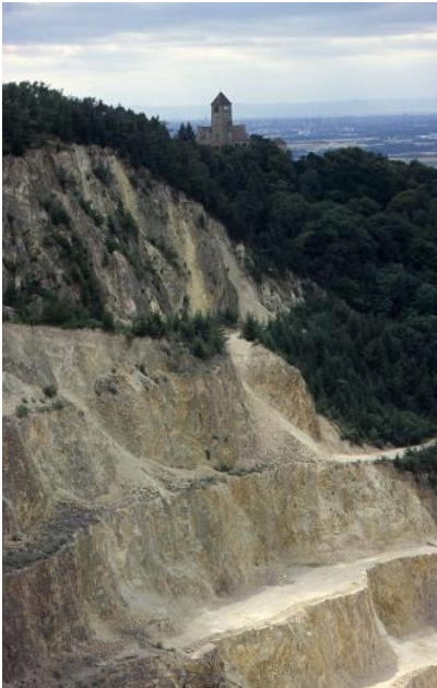
Sehr stark wechselnder Rhyolith (Quarzporphyr)

Der Quarzporphyr ist ein überwiegend dichtes, einsprenglingsarmes vulkanisches Gestein . Es besteht im Mittel zu 95 % aus Grundmasse und zu 5 % aus wenige mm-großen Einsprenglingen (überwiegend Quarz und Kalifeldspat). Eine mengenmäßig untergeordnete Rolle spielen brekziöse Varietäten . Daneben gibt es einsprenglingsreiche Quarzporphyre mit ca. 30–40 % Einsprenglingen, darunter meist verwitterte Feldspäte , die aus rohstoffgeologischer Sicht eingeschränkt oder gar nicht geeignet sind. Ebenso ungeeignet sind der Kugelrhyolith und der Lithophysenporphyr, welche aber nur eine untergeordnete Rolle spielen. Beide beinhalten Hohlräume. Der Kugelrhyolith (Quarzporphyr mit Sphärolithen) geht wohl auf Entglasungs-, der Lithophysenporphyr auf Entgasungsvorgänge zurück.