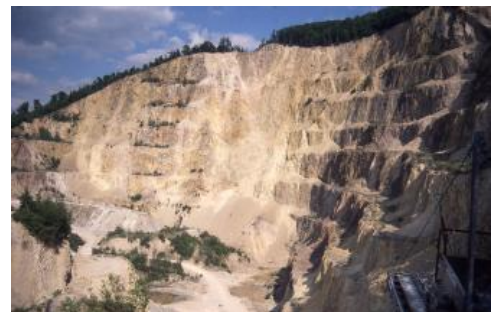
Rhyolith im Steinbruch Weinheim

„Gelbschotter“ für den einfachen Verkehrswegebau verwendet. Bei entsprechender Klüftung wie am Ölberg bei Schriesheim werden daraus auch Pflastersteine und Mauersteine für Sichtmauerwerk angefertigt.