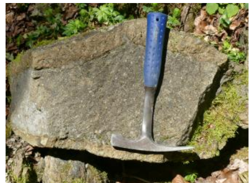
Angewitterter Deckentuff im ehemaligen Steinbruch Rielasingen-Worblingen

Verwendung: Eine Verwendung für den qualifizierten Verkehrswegebau ist aufgrund der mangelnden Frostsicherheit, wie die Gesteinsverwendung Anfang des 20. Jahrhunderts zeigte, voraussichtlich nicht möglich. Eine Verwendung im einfachen Verkehrswegebau und als Schüttgut sowie als Mauersteine ist jedoch möglich.