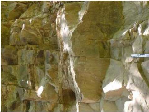
Hellbeige-grauer, massiger, harter Deckentuff

Der Deckentuff enthält Lapilli von mehreren mm bis ca. 10 mm Größe sowie zahlreiche, mehrere mm-große Einsprenglinge von Biotit, Hornblende, Pyroxen und reichlich Apatit in einer feinkörnigen Grundmasse aus Melilith, Perowskit und Magnetit. Die Hornblendestengel sind oft 5 mm lang.