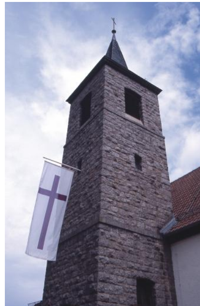
Kirchturm der evangelischen Kirche in Oberflockenbach aus Granodiorit