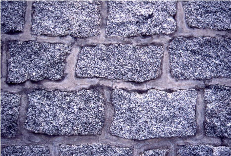
Die Fassadenverblendung eines Wasserbehälters in Ober-Laudenbach aus Granodiorit