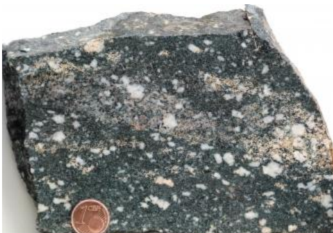
Mittel- bis grobkörniger Hornblende-Diorit mit Plagioklasblastese

Gewinnung: Im südwestlichen Odenwald steht kein Steinbruch mehr in Abbau. Im hessischen Odenwald wurde Diorit auch in größeren Steinbrüchen zu Körnungen für den Straßenbau abgebaut. Der überwiegend mittel- bis weitständig geklüftete Diorit erlaubt auch die Gewinnung großer Rohblöcke für Naturwerksteine.