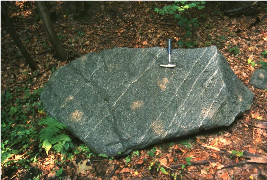
Dioritblock mit seiner typisch mittelgrauen Farbe