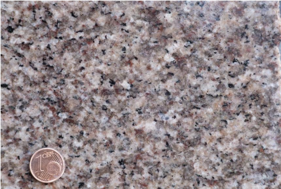
Gleichmäßiger, mittelkörniger Heidelberger Granit

Genutzte Mächtigkeit: Aufgrund der stark variierenden Ausbildung ist auch die Gesteinsqualität sehr unterschiedlich und bleibt auf den Bereich südöstlich von Oberflockenbach und Steinklingen beschränkt. Dort wurden lediglich Wollsäcke an den Hängen und kleinere Steinbrüche mit geringen Abbauhöhen zur Gewinnung herangezogen.