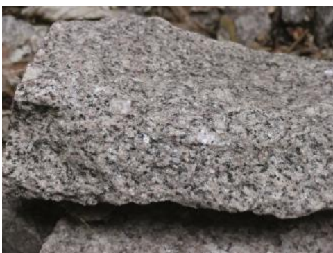
Heidelberg-Granit vom Wildeleutstein am Eichelberg

Der Heidelberg-Granit stellt das bedeutendste Tiefengestein im Grundgebirge des südwestlichen Bergsträßer Odenwalds dar. Die Bezeichnung geht auf die Typlokalität im Neckartal bei Heidelberg zurück. Der Heidelberg-Granit ist ein typischer Plutonit des variskischen Grundgebirges im Odenwald und bildet einen massigen, unregelmäßig geformten Rohstoffkörper, der im Norden und Westen vom Weschnitzpluton und Schollenagglomerat eingerahmt wird. Im Osten und Süden verhüllt ihn das Deckgebirge.