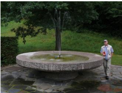
„Suppenschüssel“ von Steinklingen aus Heidelberg-Granit

Gewinnung: Im südlichen Odenwald steht kein Steinbruch mehr in Abbau. Vom Ende des 19. bis Mitte des 20. Jahrhunderts wurden geringe Mengen des harten und hochwertigen Materials am Eichelberg und Wildeleutstein südöstlich von Oberflockenbach sowie östlich von Steinklingen gewonnen.