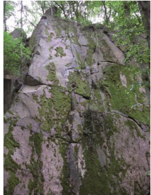
Der Heidelberg-Granitaufschluss am Wildeleutstein

Gesteinszusammensetzung variiert erheblich. Die besonders grobkörnigen Varietäten, reich an großen, idiomorphen Feldspäten, mit hohen Biotit- und niedrigen Quarzanteilen, sind für eine Verwendung ungeeignet. Die vorliegende Beschreibung bezieht sich auf den Bereich südöstlich von Oberflockenbach und Steinklingen. Hier weist der Heidelberg-Granit nur einzelne idiomorphe Feldspäte in der mittel- bis grobkörnigen Grundmasse oder nur eine nebulöse Anreicherung von Feldspäten, keine grobkörnige Ausbildung mit zahlreichen idiomorphen Feldspäten, keine Einregelung der Minerale, wenig Biotit und einen hohen Quarzanteil auf. Die Feldspäte sind 4–40, stellenweise bis 50 mm groß. Der Quarz ist 1–3 mm groß, fettglänzend, weiß bis rauchgrau, bei angewitterten Varietäten rötlich, und sitzt in Zwickeln. Bei größeren Varietäten treten auch 7–12 mm große, ovale Quarzakkumulate auf. Der schwarze Biotit entwickelt 1–4 mm große Blättchen. Charakteristisch für den Heidelberg-Granit sind neben zahllosen einzelnen dm 3 - und m 3 -großen Granitblöcken, den sog. „ Wollsäcken “, Blockmeere an den Hängen und Felsburgen im Gipfelbereich.