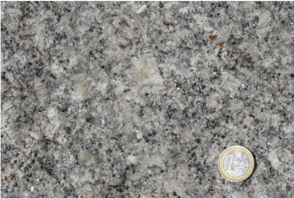
Mittel- bis grobkörniger, porphyrischer Forbach-Granit