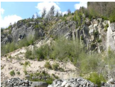
Der Forbach-Granit (GFO) und die als Raumünzach-Granit bezeichnete Varietät gehören zu den Zweiglimmergraniten des Nordschwarzwalds.

Der Forbach-Granit sowie seine Varietät Raumünzach-Granit gehören zum Nordschwarzwälder Granitkomplex . Es handelt sich hierbei um einen unregelmäßig geformten, tiefreichenden, massigen Gesteinskörper, der durch die Abkühlung einer magmatischen Schmelze vor 320 Mio. Jahren entstanden ist. Geeignete Bereiche für die Gewinnung von Natursteinen und Naturwerksteinen zeichnen sich durch einheitliche Materialeigenschaften aus. In Zonen mit intensiver Kluff- bzw. Störungstektonik, Vergrusung sowie Bereiche mit riesenkörnigen Mineralen ist eine wirtschaftliche Gewinnung der Gesteine nicht möglich.