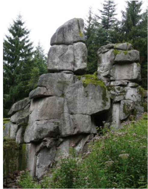
Wollsackverwitterung im Raumünzach-Granit

Der mittel- bis grobkörnige, seltener feinkörnige Forbach-Granit ist in weiten Bereichen gleichkörnig bis schwach porphyrisch ausgebildet. Nur um Raumünzach treten porphyrische Granite mit vielen Einsprenglingen auf. Feinkörnige Forbach-Granite kommen am südlichen Rand im Kontaktbereich zu den Gneisen des Schwarzwälder Gneiskomplexes sowie im Innern des Plutons bei Weisenbach vor. Mineralogisch besteht der Forbach-Granit aus weißlichen bis rötlichen, idiomorphen bis hypidiomorphen Kalifeldspäten , die auch die Einsprenglinge bilden und Kantenlängen bis 5 cm erreichen können. Weitere Bestandteile sind transparenter bis farbloser Quarz, hellgraue bis weißliche Plagioklase sowie schwarzer Biotit und silbrigweiß glänzender Muskovit als Glimmerminerale. Die Färbung des Forbach-Granits schwankt je nach Feldspat- und Biotitgehalt von weiß bis grau sowie graurot bis hellrötlich im Raum Raumünzach. Die Klüftung des Granits streicht in den Steinbrüchen um Raumünzach N–S und ONO–WSW und weist Abstände von 1–1,5 m sowie horizontale Klüfte im Abstand von 0,5–2 m auf. Dagegen tritt entlang des Murgtals zwischen Gernsbach und Reichenbach eine engständige Zerklüftung der Granite auf, welche eine Verwitterung und Vergroßung begünstigt.