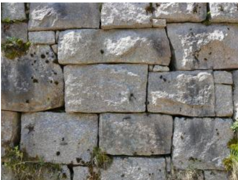
Raumünzsch-Granit kann für verschiedene Einsatzbereiche genutzt werden.

Gewinnung: Die Granite des Forbach-Granits wurden in einer Vielzahl von Steinbrüchen insbesondere entlang des Murgtals gewonnen. Heute wird die Varietät Raumünzsch-Granit in drei Steinbrüchen über mehrere Sohlen abgebaut (Stand 2013). Die Gewinnung erfolgt durch Spaltbohrlochsprengungen mit Schwarzpulver. Anschließend werden die Rohblöcke mit einem Bagger aus ihrem Verband gelöst. Mit Pressluftbohrer und Spaltkeilen werden die Rohblöcke zerkleinert und mit einer hydraulischen Spaltmaschine auf die gewünschte Größe formatiert.