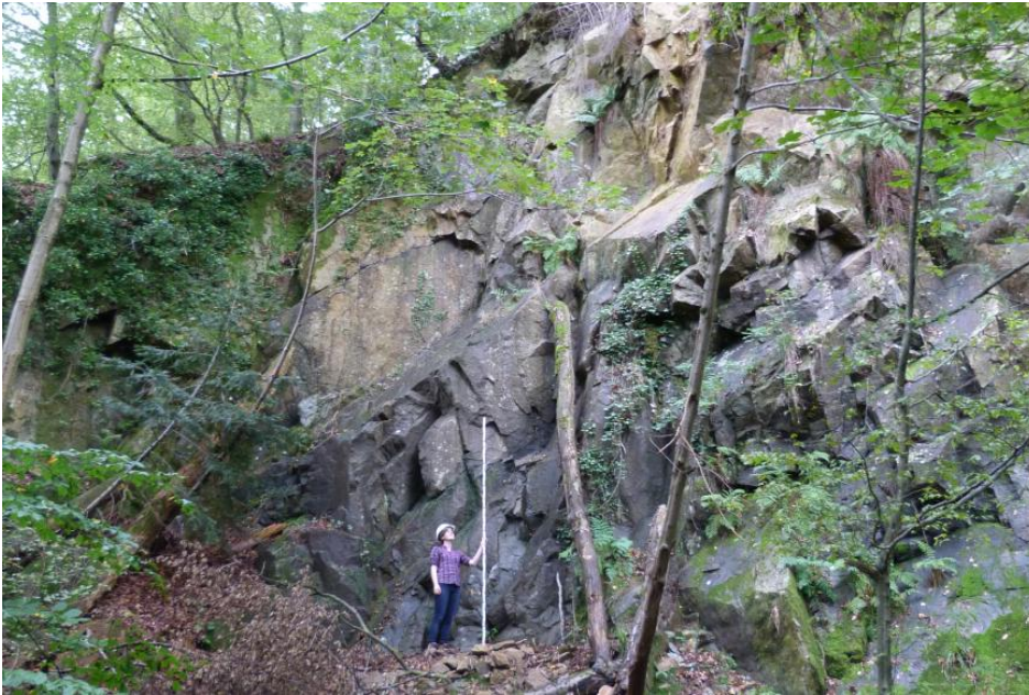
Granitporphyr im aufgelassenen Steinbruch bei Kropbach