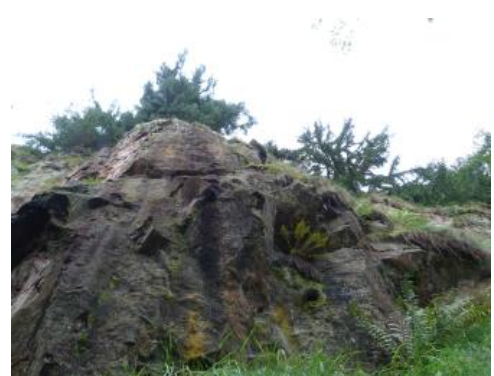
Die Granitporphyre durchschlagen als Gänge das metamorphe Grundgebirge.

Granitporphyrgang der südlich angrenzenden Badenweiler-Lenzkirch-Zone wurde auf ein Intrusionsalter von 332 Mio. Jahre datiert (Schaltegger, 2000). Nach Schleicher (1976) sind die Granitporphyrgänge im Münstertal als Produkte anatektischer Aufschmelzprozesse der den Schwarzwald unterlagernden Kruste zu sehen, welche während einer bruchtektonischen Phase ins überlagernde Grundgebirge intrudierten.