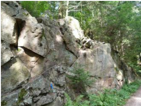
Der Zweiglimmer-Granit ist meistens homogen gleich- und mittelkörnig.

Geologische Mächtigkeit: Über Talniveau erreicht der Münsterhalden-Granit Mächtigkeiten von 200–550 m .