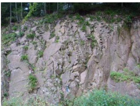
Bei dem Münsterhalden-Granit handelt es sich um einen festen, richtungslos körnigen Zweiglimmergranit.

Der Münsterhalden-Granit grenzt im Norden an die Badenweiler-Lenzkirch-Zone (BLZ) an. Es handelt sich um einen unregelmäßig geformten, massigen Gesteinskörper, der durch Auskristallisation aus einer sauren magmatischen Schmelze im Karbon (Tournais – Visée) entstanden ist. In seinen Randbereichen ist er streckenweise stark, örtlich auch schwach kataklastisch deformiert . Für die Gewinnung von Naturstein eignen sich Bereiche mit einheitlichen Materialeigenschaften. Breitere Störungszonen, Bereiche mit tiefgreifender Vergrusung oder deutlicher Kataklase sowie Partien mit riesenkörnigen Feldspäten wirken sich qualitätsmindernd auf den Lagerstättenkörper aus und werden daher nicht ausgewiesen.