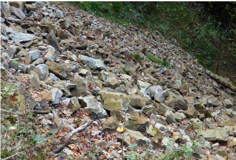
Geröllfeld aus Münsterhalden-Granit

Der Münsterhalden-Granit ist selten aufgeschlossen; er ist oft stark zerklüftet und kleinstückig zerbrechend. Hochwertige Schotter oder sogar Edelsplitte können aus dem Münsterhalden-Granit voraussichtlich nicht hergestellt werden.