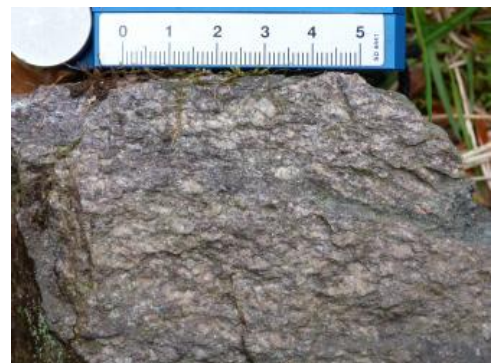
Relativ massiger Randgranit mit undeutlicher Regelung

Auf TK 25-Blatt Nr. 8112 zerfällt der anstehende Randgranit wegen der Nähe zur Überschiebungsbahn der BLZ kleinstückig . Er zeigt grundsätzlich eine hohe kleinräumige Wechselhaftigkeit in der Lithologie und führt häufig mehrere Zentimeter große, idiomorphe Kalifeldspat-Einsprenglinge . Nach Osten hin wird er vermehrt von Augengneiskörpern durchzogen. Auf TK 25-Blatt Nr. 8113 ist der Randgranit von Ruschelzonen und Augengneiskörpern durchsetzt.