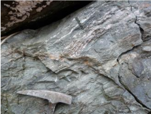
Randgranit mit deutlicher Regelung