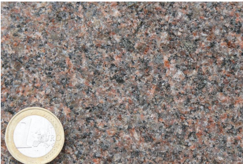
Rötliche Varietät des Malsburg-Granits aus dem Steinbruch Tegernau

In den östlichen Randbereichen des Plutons konnte zudem schwarzgrünliche Hornblende festgestellt werden. Apatit, Zirkon, Allanit, Magnetit und Calcit sind Nebengemengteile (Werner et al., 2013). Die Neigung des Malsburg-Granits zur Vergroßung und Wollackverwitterung ist meist gering, meist reicht die Verwitterungszone nur einige Meter tief. Im Anschlagbereich von großen Störungszonen, die sich meist auch im Verlauf tief eingeschnittener Täler ausdrücken, kann die Vergroßung auch bis 25 m tief in den Granit hineinreichen.