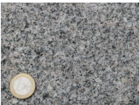
Graue Varietät des Malsburg-Granits

Nach Prüfzeugnissen der Firmen Dörflinger (D) von 1979 und Seider (S) von 1987 und Untersuchungen von Lukas (1990b) (L) ergeben sich folgende gesteinsphysikalische Daten für den Malsburg-Granit: