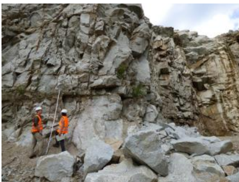
Gewinnung von Malsburg-Granit im Steinbruch

Der Malsburg-Granit, auch als „Marzell-Granit“ bekannt, gehört zu den großflächig verbreiteten und bedeutenden Südschwarzwälder Graniten. Südlich des Blauens nimmt er eine Fläche von ca. 110 km 2 ein. Geeignete Bereiche für die Gewinnung von Natursteinen und Naturwerksteinen zeichnen sich durch einheitliche Materialeigenschaften aus. In Zonen mit intensiver Kluff- bzw. Störungstektonik, tiefgreifender Vergrusung sowie in Bereichen mit sehr groben bis riesenkörnigen Feldspäten ist eine wirtschaftliche Gewinnung der Gesteine nicht möglich. Der Malsburg-Granit ist, wie die anderen Granite des Südschwarzwalds auch, durchsetzt von Granitporphyr bzw. Granophyrgängen , die bis 100 m Breite erreichen können. Das Gestein weist überwiegend ein orthogonales Kluffsystem auf (bevorzugt NW–SO und NO–SW streichend, Einfallen der Klüfte meist 70–85°). Die Kluffabstände variieren zwischen