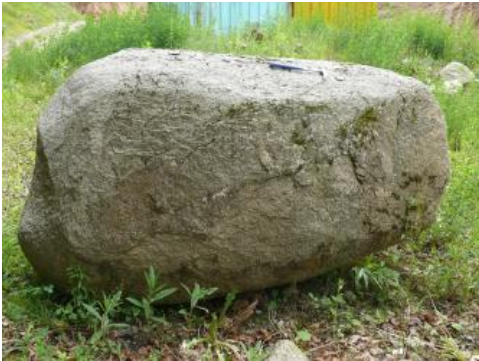
Durch Wollsackverwitterung gerundeter Granitblock

Gewinnung: Der Abbau von Malsburg-Granit geht seit Anfang des 20. Jahrhunderts insbesondere im Raum Malsburg-Marzell um. Dort sind heute fünf Steinbrüche in Betrieb. Die Gewinnung erfolgt meist durch Großbohrlochsprengungen .