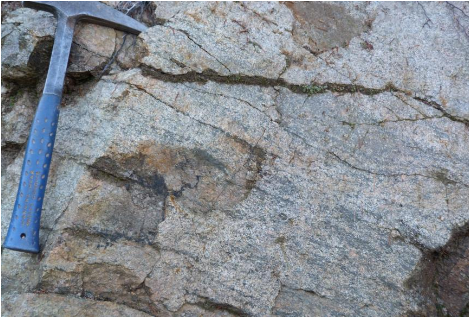
Mambach-Granit mit deutlicher Mineralregelung