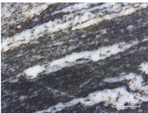
Paragneis mit metamorphem Lagenbau

Die verschiedenartigen Gneise des Südschwarzwalds bilden große Gesteinsmassen im Deckenbau des variskischen Grundgebirges; sie werden von magmatischen Gesteinen (Granite, Porphyre usw.) durchschlagen. Gneis ist ein metamorphes Gestein , das vor allem aus den Mineralen Feldspat und Quarz besteht und durch Umwandlung (Druck und Hitze) aus anderen Gesteinen – Sedimentgesteinen, Vulkaniten oder Plutoniten – entstanden ist. Diese Gesteinsumwandlung trat im Schwarzwald in einem Zeitraum vor 490–325 Mio. Jahren auf; die wichtigste Metarmorphose war die Hochtemperatur-Niederdruck-Metarmorphose in einem Zeitraum vor 340–330 Mio. Jahren. Während dieser Metarmorphose konnte es bei zunehmender Aufheizung der Gesteine – sofern ausreichend Wasser und Gase im System vorhanden waren – zu granitartigen Aufschmelzungen der Gneise kommen; Metamorphite mit solchen