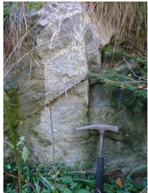
Massiger, gleichkörniger, diatektischer Paragneis