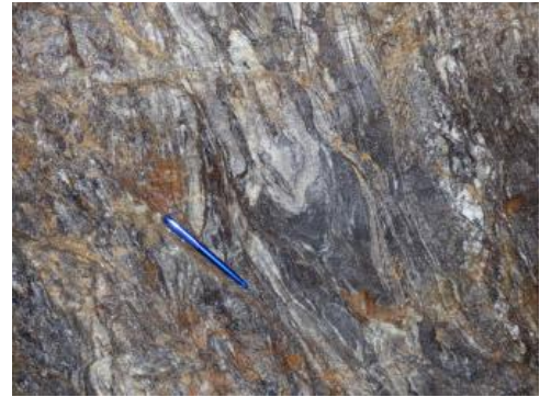
Metatektische Paragneise im Untertage-Aufschluss

Die metamorphe Gesteinsserie besteht aus Diatexiten, Metatexiten und Paragneisen . Die Hauptbestandteile der meist mittelkörnigen Gneise des Arbeitsgebiets sind Quarz, Feldspäte und Biotit , stellenweise treten geringe Anteile von Cordierit und Sillimanit sowie opake Erzminerale (Magnetit, Pyrit, Hämatit) hinzu. Gneise weisen ein weites Spektrum an Texturen auf (siehe Abbildungen), die kleinräumig variieren und ineinander übergehen. Charakteristisch ist eine unterschiedlich stark ausgeprägte lagige Textur, die durch den metamorphen Lagenbau mit dunklen biotitreichen und hellen quarzfeldspatreichen Abschnitten geprägt ist. Typisch sind tektonische Verfaltungen im cm- bis dm-Maßstab. Mit zunehmender Aufschmelzung des Gesteins nimmt der Anteil an hellen quarzfeldspatreichen Partien zu, während die Foliation nur noch an reliktischen Schlieren zu erkennen ist.