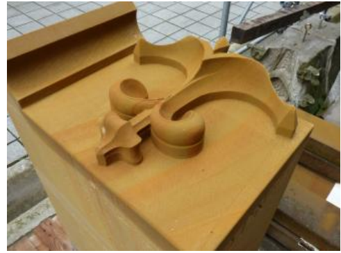
Maßwerk aus Lauchheimer Eisensandstein

Weitere Informationen finden sie hier: Naturwerksteine aus Baden-Württemberg (2013)/Eisensandstein