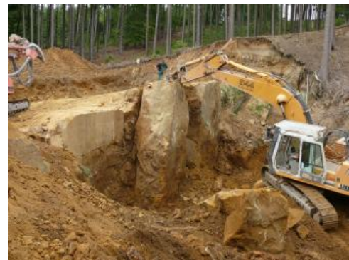
Lösen eines Steinblocks mit dem Reißbagger

Genutzte Mächtigkeit: Als witterungsbeständiger Naturwerkstein eignen sich nur die ferritisch gebundenen Sandsteine des Unteren Donzdorf-Sandsteins von der Ostalb (Westerhofener Sandstein). Sie erreichen im Steinbruch Banzenmühle bei Lauchheim ca. 4–5 m Mächtigkeit in der nutzbaren „Kernbank“, zusammen mit den überlagernden plattigen Abschnitten rund 7 m .