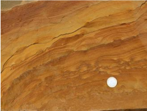
Feinkörniger Quarzsandstein der Eisensandstein-Formation