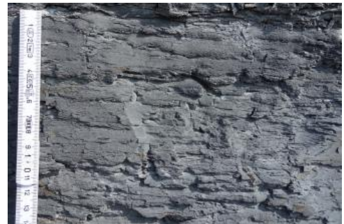
Bituminöser Mergelstein, auch „Wildschiefer“ genannt

Für die Verwendung als Naturwerksteine eignet sich jedoch nur der sog. „Fleins“, wobei es sich um gebankte Kalk- bis Mergelkalksteine handelt.