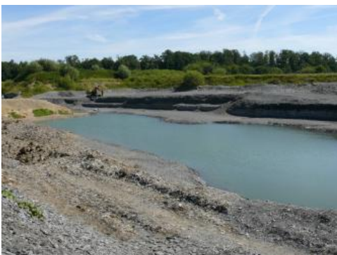
Abbau des Fleins als Naturwerkstein

Geologische Mächtigkeit: Die Gesamtmächtigkeit der Posidonienschiefer-Formation schwankt zwischen nur 1 m an der östlichen Landesgrenze und rund 30 m im Kraichgau. Im Bereich der Schwäbischen Alb variiert die geologische Mächtigkeit von 6–12 m .