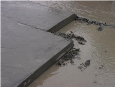
Gewinnung des Fleins im Steinbruch Ohmden I

Die Gesteine der Posidonienschiefer-Formation wurden vor ca. 180–184 Mio. Jahren in einem flachen, schlecht durchlüfteten Meeresbecken mit stabiler Dichteschichtung und mit nur geringem vertikalem Austausch, abgelagert. Während der Bildung der Posidonienschiefer-Formation kam es unter sauerstoffarmen Bedingungen zur Ablagerung von Ton-, Mergel- und Kalksteinen mit erhöhten Bitumenanteilen.