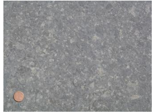
Gesteinsplatte aus dem Posidonienschiefer

Gewinnung: Früher wurden gelegentlich die Horizonte „Unterer Stein“ und „Oberer Stein“ als Mauersteine gewonnen, wobei nur der so genannte „Untere Stein“ frostbeständig ist. Heute wird zur Gewinnung von Werksteinen nur noch der Fleins abgebaut, der sich zur Herstellung von Dekorationssteinen eignet. Der Abbau ist so auszuführen, dass geschützte Versteinerungen möglichst wenig gefährdet sind und möglichst vollständig geborgen werden können, die Gewinnung erfolgt deshalb durch Reißen . Der überlagernde Abraum wird mittels Bagger abgetragen und manchmal wird zur Auflockerung des Gesteinsverbandes eine schwache Sprengung durchgeführt. Die im Bereich Holzmaden etwa 18 cm mächtige Fleinsbank wird mehrfach gespalten (drei bis vier Mal) und die entstehenden Rohblöcke werden zur weiteren Verarbeitung in ein Werk abtransportiert. Die Platten werden geschliffen und poliert oder bruch- bzw. spaltrau verwendet.