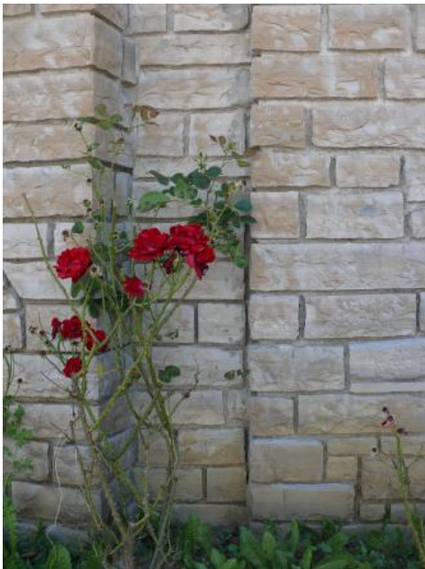
Mauer aus Kalksteinen aus dem Posidonienschieferhorizont des Unteren Steins

Verwendung: Früher wurden aus dem Posidonienschiefer auch Dachschieferplatten hergestellt. Heute findet er überwiegend in der Innenarchitektur Verwendung, wie z. B. für Wandverkleidungen, Fensterbänke, Treppenstufen und Tischplatten sowie Deko-Objekte (Wand- und Tischuhren, Wetterstationen, Aschenbecher, Geschenkartikel etc.). Im Außenbereich findet der Posidonienschiefer aufgrund seiner geringen Verwitterungsbeständigkeit heute keinen Einsatz mehr: das Gestein spaltet unter Frosteinwirkung auf und zerfällt in dünne Platten und Scherben.