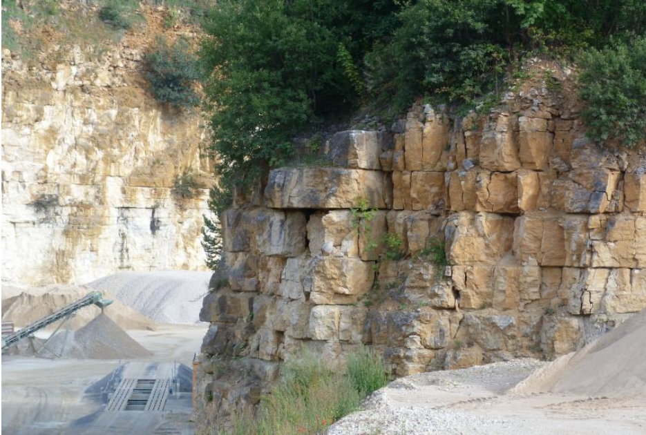
Kalksteine der Untere-Felsenkalke-Formation