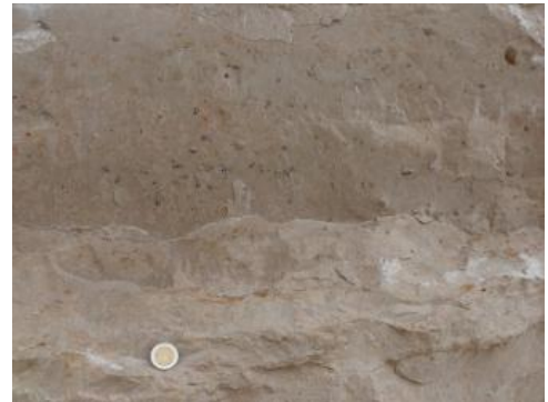
Fossilreiche Quaderkalke, auch als „Tuttlinger Marmor“ bezeichnet

Die „Quaderkalke“ der Untere-Felsenkalke-Formation bilden einen auch als „Tuttlinger Marmor“ bekannten, dickbankigen Kalkstein mit annähernd orthogonaler Klüftung auf der Baaralb bei Immendingen und Tuttlingen. Es handelt sich um harte, hellbeigegraue, hellgraue, beigebraune, untergeordnet braunrötliche, dichte, auch fossilreiche Kalksteine, welche dickbankig bis massig (Bankstärken 1–3 m, im Mittel 1,5 m) entwickelt sind. Die Kluftabstände belaufen sich auf 0,1–5 m, im Mittel auf 1,5–2 m. Neben den dickbankigen Partien kommen auch 0,1–0,5 m mächtige Bereiche vor. Die dünnbankigen Partien spalten alle auf. Die Dickbänke spalten z. T. dünnbankig und dünnplattig auf. Das Gestein bricht meist splittrig.