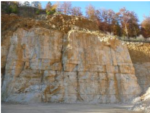
Abbauwand: ZuckerkornloCHFels über Quaderkalken

Geologische Mächtigkeit: Die Mächtigkeit der gesamten Untere-Felsenkalke-Formation beträgt bis zu 55 m . Östlich von Immendingen ist der untere Teil der Untere-Felsenkalke-Formation als „Quaderkalke“, nördlich von Tuttlingen dagegen der obere Abschnitt als „Quaderkalke“ entwickelt.