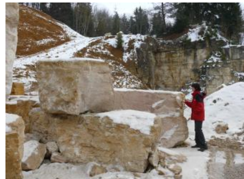
Die dickbankigen Kalke zeichnen sich durch Witterungsbeständigkeit aus.

Gewinnung: Im Steinbruch Tuttlingen (Eichen) (RG 7918-2) werden dickbankige Kalksteine („Quaderkalke“) der Untere-Felsenkalke-Formation für Werkstein- und Natursteinzwecke durch Bohren und Abspalten abgebaut. In der Vergangenheit wurden bis etwa in die 1940er Jahre u. a. die aufgelassenen Steinbrüche am Fraunholz östlich von Immendingen zur Gewinnung der Quaderkalke herangezogen. Etwa 50 % des gebrochenen Materials waren werksteintauglich.