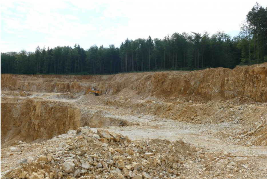
Kalksteinabbau für das Zementwerk Heidenheim an der Brenz

Genutzte Mächtigkeit: Die genutzte Mächtigkeit liegt zwischen 40 und 70 m .