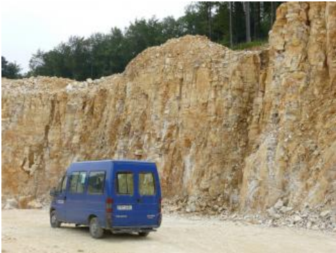
Mikritische Kalk- bis Kalkmergelsteine

Auf der Ostalb werden graue bis graublaue Mergel- und Kalkmergelsteine ( Mergelfazies ) sowie feinkörnige, tonige, hellgraue bis gelbliche Kalk- bis Kalkmergelsteine ( Bankkalfazies ) der Mergelstetten-Formation als Zementrohstoffe gewonnen. Als Zuschlagstoffe können folgende Gesteine verwendet werden: