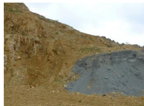
Übergang von Massenkalksteinen zu Mergelsteinen

Auf der Schwäbischen Alb treten zahlreiche Lagerstätten von Zementrohstoffen auf. Im Bereich der Ostalb bilden die Gesteine des oberen Oberjuras einen geschichteten, flächenhaft verbreiteten Rohstoffkörper, der mit wenigen Grad nach Süden bis Südosten einfällt. Wirtschaftlich interessante Partien bestehen überwiegend aus einer geeigneten Kombination von Bankkalksteinen , Mergelsteinen und Massenkalksteinen, die in sog. Zementmergelwannen bzw. in dazwischen liegenden Schwamm-Mikroben-Hügeln (Bioherme) entstanden sind. Bedeutung als Zuschlagstoffe erlangen auch die als Erosionsreste auf den Karbonatgesteinen lagernden Tone und Süßwasserkalksteine des Tertiärs. Die Abgrenzung von Vorkommen erfolgt anhand der nutzbaren Mächtigkeit und des erforderlichen Vorrates (gefordert: > 100 Mio. t); Ausschlusskriterien sind starke Dolomitisierung der Kalksteine, u. U. tektonische Störungen, große Eintalungen sowie nicht verwertbare Deckschichten mit einer Mächtigkeit über 10 m.