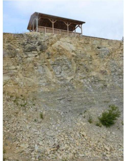
Übergang von Zwischenkalken zu Mergelsteinen

Verwendung: Verarbeitung zu Portland- und Spezialzementen .