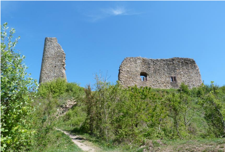
Die Schneeburg am Schönberg

Verwendung: Je nach Reinheitsgrad kann das aufbereitete Tertiärkonglomerat als reiner Kalkstein für Branntkalk, für die Herstellung von Putzen und Estrich oder als Schotter für den unqualifizierten Wegebau sowie für die Produktion von Gesteinsmehlen genutzt werden.