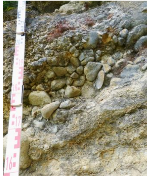
Gerölle unterschiedlicher Größe im Tertiärkonglomerat

Das Tertiärkonglomerat besteht aus einer Wechselfolge von einem Dezimeter bis mehrere Meter mächtigen Schichten aus groben Kalksteinkonglomeraten (Gerölldurchmesser bis 40–50 cm, teilweise auch größer), feineren Konglomeratlagen und (teilweise geröllführenden) Ton- bis Kalkmergelsteinen . Die Geröllführung umfasst Kalksteine und Kalksandsteine des Juras , vor allem des Mitteljuras und der Trias. Im proximalen östlichen Abschnitt liegen die Konglomeratmassen fast geschlossen mit Mächtigkeiten von 40–90 m vor. Nach Westen, d. h. Richtung Oberrheingraben, nehmen die Konglomeratlagen rasch an Mächtigkeit ab und Mergel und Kalksandsteinlagen anteilig zu. Schon 500 m westlich der aus Kalksteinkonglomeraten aufgebauten Gipfel (z. B. Schönberg und Urberg) überwiegen Kalksandsteine mit zwischengeschalteten Mergellagen. Innerhalb eines Schüttungsgebiets verringert sich die Geröllgröße von unten nach oben. Die Konglomerate sind unterschiedlich stark diagenetisch verfestigt. Neben massigen bis dickbankigen Konglomeraten mit einer karbonatischen, stark konsolidierten Matrix liegen Schichten mit Kalksteingeröllen in einem tonig-lehmigen, fast unverfestigten Bindemittel vor.