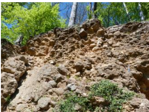
Mittelalterlicher Steinbruch am Schönberg

Die Gesteine der Küstenkonglomerat-Formation (auch „Tertiärkonglomerat“) entstanden entlang der Grabenränder während der raschen Heraushebung des Grundgebirges und der einhergehenden Abtragung der Schichten von Oberjura bis Muschelkalk . Kleinräumig wechsellagernd und lateral wie vertikal verzahnt treten grobe Kalkstein-Konglomerate, (untergeordnet) plattige Kalksandsteine und geröllführende, mergelige Schuttkalke auf. Zwischen einzelnen Schüttungskörpern können tonig-mergelige Lagen eingeschaltet sein. Die Schichten aus Küstenkonglomeraten (tKK) wurden tektonisch nur relativ gering beeinflusst. Die Abgrenzung von wirtschaftlich gewinnbarem Material, welches nach der Aufbereitung für hochwertige Naturstein-Körnungen oder für Kalkmehle verwendet werden kann, richtet sich nach Anteil und der Qualität der Hauptrogensteingerölle, nutzbarer Mächtigkeit, Anteil mergeliger