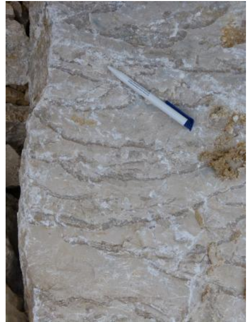
Korallenkolonien in mikritischer Matrix

Produziert werden in Istein gebrannte und ungebrannte Kalkmehle für die Stahlindustrie, chemische Industrie und die Papierherstellung sowie Edelputze . Die ungebrannten Produkte reichen vom Feinmehl bis zum Kalksteinschotter, zu den gebrannten Kalkprodukten gehören Weißfeinkalk, körniger Branntkalk und Stückkalk (für Kalksandsteinherstellung, Hochofenzuschlag im Stahlwerk, Futtermittel, Dünger); daneben wird Weißkalkhydrat (gelöschter Kalk) erzeugt.