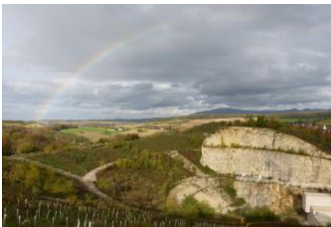
Übersicht über den Steinbruch Huttingen.

Geologische Mächtigkeit: Die Kalksteine der Korallenkalk-Formation erreichen eine Mächtigkeit von durchschnittlich 60 m . Davon sind die untersten 40 m mächtige Korallenkalke, darüber lagern etwa 20 m Splitterkalke. Die Kalksteine der Nerineenkalk-Formation besitzen im Raum Istein eine Restmächtigkeit von mehr als 16 m , nördlich davon sind sie bereits gänzlich erodiert.