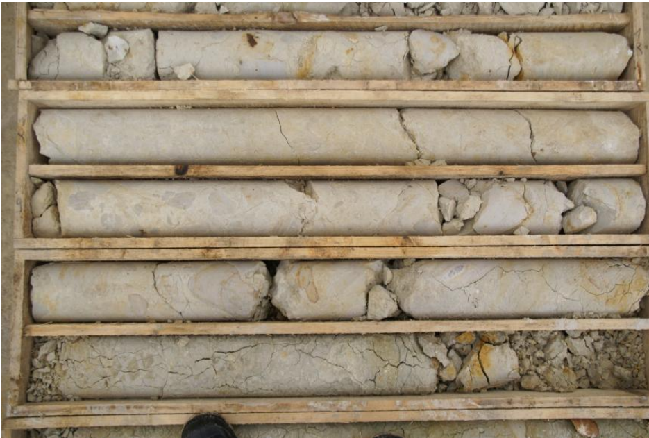
Korallen in beige-hellgrauem Kalkstein

Einfallen der Schichten, der nutzbaren Mächtigkeit, dem Grad der Verkarstung und der Mächtigkeit der überlagernden nicht nutzbaren Schichten abhängig. Kalksteine der Korallenkalk-Formation treten am südlichen Oberrhein in der Vorbergzone zwischen Kandern und Holzen, zwischen Tannenkirch und Liel sowie am Isteiner Klotz auf. Gewonnen wird der Korallenkalk im großen Steinbruch Kapf bei Huttingen, Gemeinde Efringen-Kirchen.