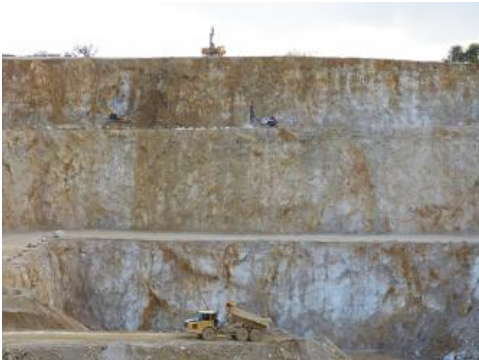
Gewinnung von oberjurassischen Kalksteinen der Korallenkalk- und der Nerineenkalk-Formationen

Die Kalksteine der Korallenkalk- und der Nerineenkalk-Formationen sind am Südlichen Oberrhein die jüngsten erhaltenen mesozoischen Einheiten ; sie werden von eozänen und oligozänen Sedimenten überlagert. Die Oberjura-Kalksteine bilden massige bis geschichtete Rohstoffkörper, die aufgrund der Tektonik im Oberrheingrabenrand in einzelne Bruchschollen zerlegt sind. Die Einzelschollen erreichen eine Ausdehnung von mehreren Kilometern. Die Schichten fallen wegen der tektonischen Zerlegung der Vorkommen unregelmäßig in verschiedene Richtungen ein. Es überwiegen geringe Einfallswinkel mit Einfallrichtungen nach West oder Ost. Selten fallen die Gesteine mit über 20° ein. Besonders im Raum zwischen Liel und Holzen wurden die Kalksteine von einer Bretterklüftung mit intensiver Verkarstung betroffen. Die Größe der nutzbaren Vorkommen ist vor allem von der lateralen Ausdehnung der einzelnen tektonischen Schollen, dem