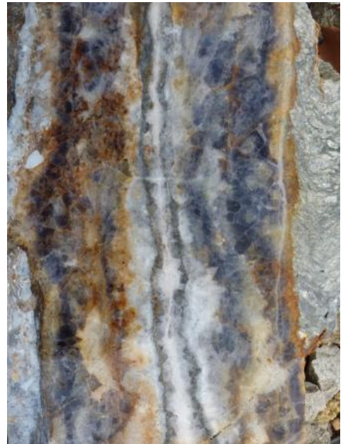
Typisches Erscheinungsbild des Finstergrund-Ganges