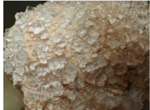
Klare Flussspatkristalle aus der Grube Clara

Gewinnung: Die Gewinnung von Flussspat begann im 20. Jahrhundert. Hauptproduzenten für Flussspat waren die Gruben im Münstertal, St. Blasien, Aitern, Grafenhausen, Igelschlatt, Brenden und Brandenburg im Südschwarzwald. Die wichtigste Gewinnungsstelle war die Grube Käfersteige südöstlich von Pforzheim, die zu den größten Ganglagerstätten Europas zählt. Bis zur Stilllegung der Grube konnte der Gang auf einer Länge von 1200 m und über mindestens 400 m Tiefenerstreckung in bauwürdiger Mächtigkeit nachgewiesen werden. Im Schwarzwald wird Flussspat nur in der Grube Clara (RG 7615-1) gewonnen. Fluor gehört zu den, hinsichtlich der Versorgungssicherheit der deutschen Industrie, als „kritisch“ eingestuften Elementen, weil die in Nutzung stehenden Fluorit-Lagerstätten zu einem großen Teil in Ländern liegen, welche den eigenen Export beschränken (z. B. China). Besonders im Schwarzwald ist aber ein großes ungenutztes Flussspatpotenzial zu erwarten.