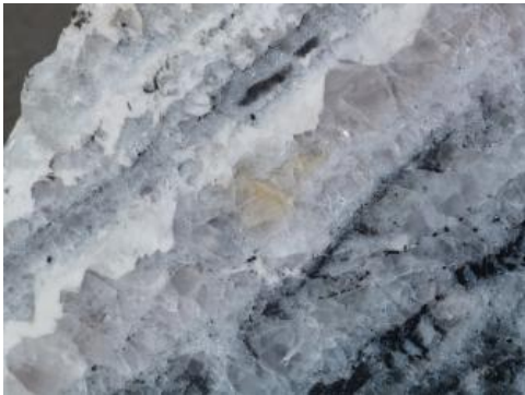
Gangstück mit klarem bis leicht violetter Flussspat

Verwendung: \text{CaF}_2 wird in der chemischen Industrie verwendet, um z. B. Flusssäure herzustellen. Weiterhin wird es zur Produktion von Kryolith ( \text{Na}_3\text{AlF}_6 ) genutzt. Bei der Aluminiumerzeugung aus Bauxit wird synthetischer Kryolith eingesetzt, da er den Schmelzpunkt herabsetzt. In der Metallurgie dient \text{CaF}_2 als Flussmittel für die Schlacke bei der Eisenverhüttung. Weitere Verwendungsbereiche liegen in der Keramik- und Glasindustrie, Schweißtechnik sowie als Pflanzenschutzmittel und Zahnpasta.