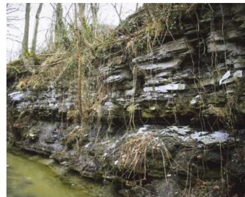
Posidonienschiefer (juPO): Anschnitt im Bett des Riegelbachs westlich des Riegelhofs

Der Obere Unterjura (früher: Schwarzjura epsilon/zeta) beginnt mit der Posidonienschiefer-Formation (juPO). Sie besteht aus bituminösen Kalk- und Tonmergelsteinen. Darüber folgen die Tonmergelsteine der Jurensismergel-Formation (juJ), in die Kalksteinbänke eingeschaltet sind.