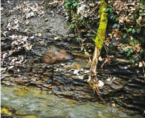
Amaltheenton-Formation (juAMT): Riegelbach zwischen Laubach und Riegelhof

Der Mittlere Unterjura (früher: Schwarzjura gamma/delta) setzt mit den Mergelsteinen und Tonmergelsteinen der Numismalimergel-Formation (juNM) ein. Im Hangenden folgt die Amaltheenton-Formation (juAMT) mit Tonmergelsteinen, im oberen Anschnitt mit einer oder mehreren Kalksteinbänken (Septarienkalk, Costatenkalk).