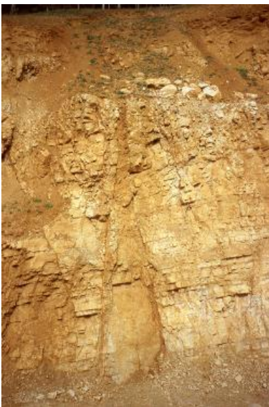
Hauptrogenstein-Formation (jmHR): Steinbruch der Fa. Marmorit, Bollschweil

Im Oberrhein- und Hochrheingebiet, im Wutachgebiet und auf der Westalb bis in den Raum Balingen liegt darüber die Gosheim-Formation (jmGOS). Sie besteht aus Eisenoolithen und geht im höheren Teil südlich und östlich von Spaichingen zunehmend über in eine ooidfreie Tonmergelstein-Kalkstein-Wechselfolge. Auf der Ostalb folgt auf die Wedelsandstein-Formation direkt die Sengenthal-Formation (jmS). Das sind ebenfalls Eisenoolithe, die jedoch auch eisenoolithische Kalk- und Kalkmergelsteine beinhalten. Sie wurden bis in den unteren Abschnitt der Ornatenton-Formation (jmOR) abgelagert.