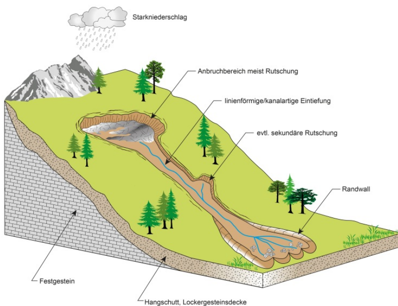
Schematisches Blockbild einer Hangmure mit typischen Charakteristika im Gelände

Hangmuren entstehen besonders häufig an steilen Hangabschnitten mit gering durchlässigen Lockergesteinsauflagen (z. B. Hanglehm). Nach entsprechender Wasseraufsättigung führt der hohe Wasseranteil im Versagensfall zu hohen Bewegungsgeschwindigkeiten von bis zu mehreren Zehner Stundenkilometer. Im Unterschied zu Murgängen sind Hangmuren nicht an einen Taleinschnitt oder eine Erosionsrinne gebunden und können somit größere Breiten aufweisen. Mündet eine Hangmure in eine wasserführende Erosionsrinne, kann sich daraus ein Murgang entwickeln.