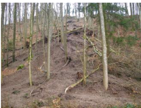
Hangmure bei der Burg Waldenstein bei Rudersberg, Rems-Murr-Kreis

Hangmuren entstehen besonders häufig an steilen Hangabschnitten mit gering durchlässigen Lockergesteinsauflagen (z. B. Hanglehm). Nach entsprechender Wasseraufsättigung führt der hohe Wasseranteil im Versagensfall zu hohen Bewegungsgeschwindigkeiten von bis zu mehreren Zehner Stundenkilometer. Im Unterschied zu Murgängen sind Hangmuren nicht an einen Taleinschnitt oder eine Erosionsrinne gebunden und können somit größere Breiten aufweisen. Mündet eine Hangmure in eine wasserführende Erosionsrinne, kann sich daraus ein Murgang entwickeln.