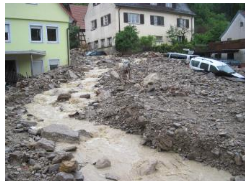
Ablagerungen des „Sturzflutereignisses“ in der Ortslage von Braunsbach

Aufgrund des „Sturzflutereignisses“ in Braunsbach im Jahr 2016 rückten die murgangähnlichen Ereignisse in Baden-Württemberg stärker in den Fokus. Zur Planung vorbeugender Sicherungsmaßnahmen (Murgang- bzw. Geröllgangsperrern) in Braunsbach und den benachbarten Gemeinden wurde die mobilisierbare Geschiebemenge und die Transportkapazität sowie die Erosionsempfindlichkeit der in Bachrinnen auftretenden (Locker-) Gesteine beurteilt. Zurzeit ist die Beurteilung der Erosionsempfindlichkeit für die lithologischen Einheiten Baden-Württembergs in Arbeit. Die Bewertung der Erosionsempfindlichkeit wird anhand verschiedener Pilotgebiete validiert. In einer ersten Untersuchungsstufe sind Pilotgebiete bei Neckargerach (Gesteine des Buntsandsteins im Odenwald), bei Baienfurt (Gesteine der Oberen Süßwassermolasse im Alpenvorland), bei Schramberg (Gesteine der Rotliegend-Sedimente bis Unterer Buntsandstein im Schwarzwald) sowie im Suggental ( Paragneise und Flasergneise des Gneis-Migmatit-Komplexes im Schwarzwald) vorgesehen. Ziel ist es, die Ingenieurgeologische Gefahrenhinweiskarte von Baden-Württemberg (IGHK50) um den Themenbereich erosionsempfindliche und veränderlich feste Gesteine zu erweitern.