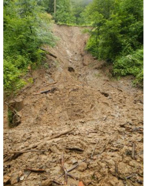
Murgang bei Waldkirch, Lkr. Emmendingen

In einem Murgang bewegen sich stark wasserdurchtränkte Lockermassen (ähnlich einer sehr groben Suspension) mit sehr hohen Geschwindigkeiten von Metern pro Sekunde hangabwärts. Murgänge folgen dem vorgegebenen Verlauf von Bachbetten und Erosionsrinnen. Im Gegensatz zum Schutt- oder Blockstrom ist der Murgang plötzlich auftretend, reicher an Wasser und zeichnet sich i. d. R. durch ein sehr großes Zerstörungspotenzial aus.