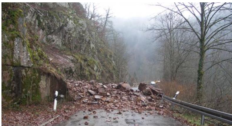
Felssturz an der Kreisstraße K 6561 bei Berau, Lkr. Waldshut

Bei Sturzprozessen handelt es sich um schnelle Massenbewegungen, bei denen Fest- und/oder Lockergestein in einem steilen Hang entlang von Trennflächen ausbricht und überwiegend frei fallend, springend und/oder rollend abstürzt. Beim Aufprall des stürzenden Materials kann dieses (abhängig von der Untergrundbeschaffenheit und der Flugbahn) in kleinere Teile zerbrechen. Als potenzielle Ausbruchgebiete für Sturzprozesse gelten i. A. Hangbereiche mit Neigungen > 35^\circ . Sogenannte „Stumme Zeugen“ – alte Sturzblöcke oder Einschlüge (Schlagmarken) der Komponenten im Untergrund oder an Bäumen – lassen die Sprungweite und -höhe sowie die Reichweite von Steinschlägen bis Felsstürzen erkennen.