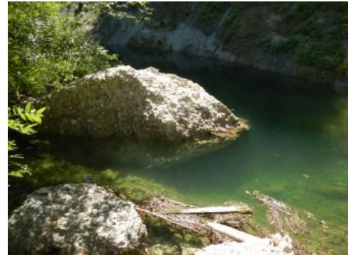
Aufgestaute Eschach im Oberstrom des Schadensbereichs

Aufgrund der großen Masse des Sturzblockes von ca. 2000 t wurden beim Aufprall in das Bachbett der Eschach sowohl Wasser als auch Gestein bis zu 100 m weit heraus geschleudert. Dieser ausgelöste Steinschlag verursachte Schäden an der angrenzenden Wiese, aber auch an einer im Tal verlaufenden Kreisstraße (OA20, K8045) sowie an benachbarten Gebäuden und geparkten Fahrzeugen. Der im Bachbett liegende Sturzblock staute die Eschach etwa 4 m auf und ließ somit einen rund 6 m breiten See entstehen.