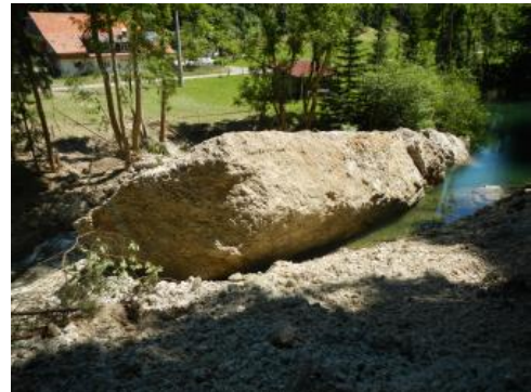
Sturzblock von insgesamt etwa 800 Kubikmeter blockiert den Abfluss der Eschach

Am Abend des 23. Juni 2015 ereignete sich im Eschachtal (Oberallgäu) an der Landesgrenze Baden-Württembergs ein Felssturz. Ein ca. 800 m 3 großer Felsblock löste sich an der baden-württembergischen Uferseite aus maximal 25 m Höhe und kippte in das Bachbett der Eschach. Hierbei entstand durch aus dem Bachbett ausgequetschtes und bis zu 100 m weit herausgeschleudertes Gestein auf dem Gebiet der bayerischen Gemeinde Buchenberg erheblicher Sachschaden an Gebäuden und Fahrzeugen.