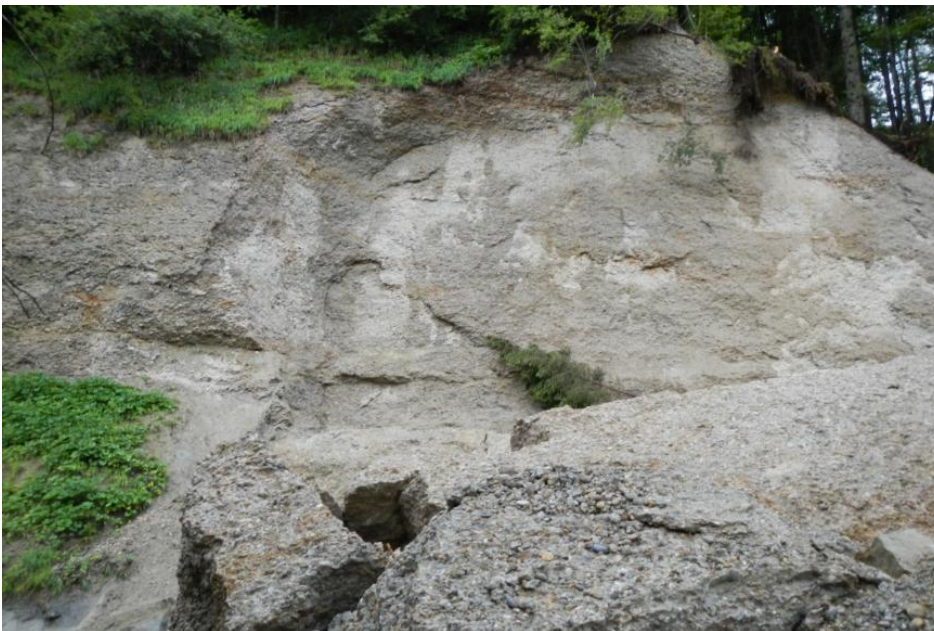
Felswand mit Ausbruchnische am baden-württembergischen Ufer der Eschach

Die Bachböschung wird aus Gesteinen der ungefalteten, horizontal lagernden Oberen Süßwassermolasse (tOS) aufgebaut. Der Sturzkörper besteht aus einem kompakten Konglomerat, während darunter weniger verfestigte Konglomerate und Sandsteine sowie eine mehrere Meter mächtige Mergelsteinlage anstehen (Bayerisches Landesamt für Umwelt, 2015).