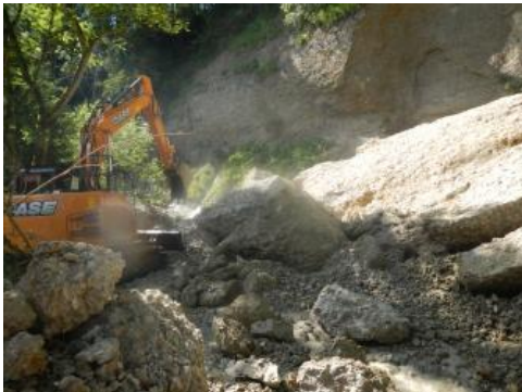
Bagger beim Beräumen des Bachbettes

Ziel der durchgeführten Maßnahmen nach dem Felssturz war, den Eschachaufstau zu beseitigen und einen angemessenen Abflussquerschnitt wiederherzustellen. Durch die Beseitigung des Aufstaus wurden die Auswirkungen bei einem weiteren möglichen Versagen der in der Felswand verbliebenen labilen Gesteinsmassen deutlich reduziert. Insbesondere war kein Wasserschwall mehr zu befürchten. Weiterhin sorgte die Absenkung des Wasserspiegels für eine Reduzierung der Durchfeuchtung des Fußbereiches der labilen Gesteinsmassen und somit für eine Stabilisierung der Gesamtsituation.