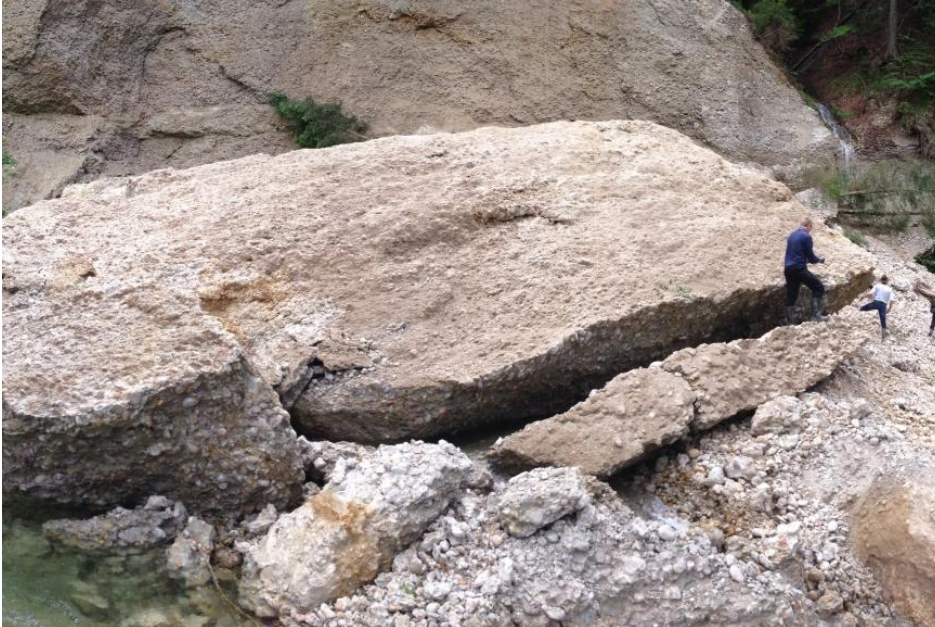
Sturzmasse im Bachbett der Eschach