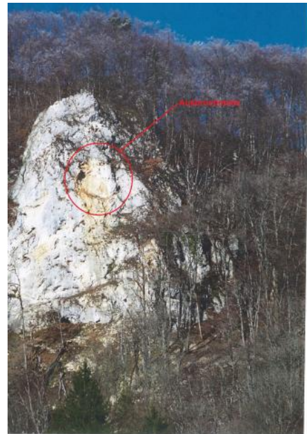
Detailfoto der Ausbruchsstelle des Felssturzmaterials auf Höhe des Eichfelsens