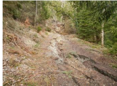
Frische Abrisskante im Forstweg

Durch den impulsartigen Niedergang der Felsmassen kam es im Aufschlagsbereich zu einer teilweisen (Re-) Mobilisierung alter Rutschmassen, die in einer rinnenförmigen Struktur auf einer Länge von ca. 90 m talwärts geglitten sind. In diesem ca. 35° steilen Bereich ist die Rutschmasse geringmächtig resp. die Rutschung flachgründig und lokal mit Blockschutt der hangseitigen Felswand durchsetzt. Talseits hat sich westlich daran anschließend eine bis zu 50 m lange Abrisskante gebildet, entlang derer der Forstweg in mehreren Leisten treppenartig um bis ca. 0,5–1,0 m abgesackt war. Insgesamt umfasst dieser untere, mittelgründige Rutschbereich ein ca. 20° geneigtes und somit deutlich flacheres Gebiet von ca. 80 m x 50 m mit mehr oder weniger deutlichen Anzeichen frischer Deformationen und Zugspalten innerhalb der mächtigeren Lockergesteinsbedeckung.