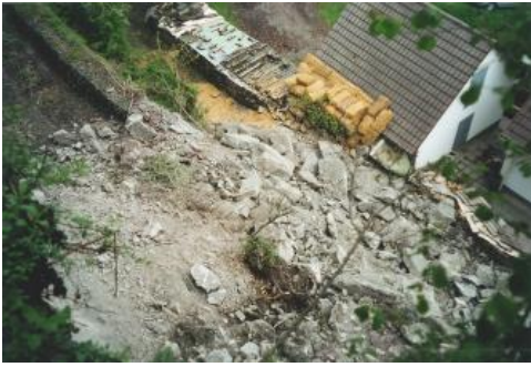
Schadensbild hinter der Wohnbebauung

Im Zuge der Sofortmaßnahmen erfolgte nach der Evakuierung zunächst eine umgehende Sicherung des Wohngebäudes durch einen umfangreichen, bis zum Dachtrauf reichenden Strohballenverbau. Anschließend wurden die Sturzmassen sukzessive entfernt sowie am Nord- und Südrand der Ausbruchsstelle Reste der nach dem Felssturz verbliebenen Wandschale abgetragen.