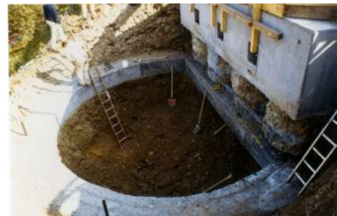
Herstellung eines Brunnens

Um weitere Schäden an den Straßen, Gebäuden und Versorgungsleitungen zu verhindern, wurde eine umfangreiche Sanierung erforderlich. Aufgrund des erkennbaren starken Einflusses von Niederschlags- und Sickerwasser wurde eine effektive Hangentwässerung angestrebt. Daher wurden entlang der Happoldstraße und dem Burghaldenweg elf Brunnen mit einem Durchmesser von 5 m und Tiefen zwischen 10 m und 17 m bis in die anstehende Grabfeld-Formation abgeteuft und an der Sohle hydraulisch miteinander verbunden. Von den Brunnen aus in den Berg hinein vorgetriebene Entwässerungsbohrungen sollten möglichst viel Wasser bereits vor Eintritt in die Rutschmassen erfassen und ableiten. Die Brunnen dienten neben der Entwässerung auch einer Verdübelung der Rutschmassen. Sie wurden mit jeweils vier rückverankerten bewehrten Bohrpfählen an der bergseitigen Brunnenwand gesichert. Diese Maßnahmen zeigten noch während der Bauarbeiten Wirkung und die Hangbewegungen sind in der Folgezeit rasch abgeklungen (Wichter et al., 1991).