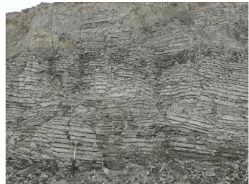
Detailaufnahme des Bändertons eines Eisstausees

Verwendung: Aus dem gewonnenen Material wird zusammen mit den Mergeltonsteinen der Unteren Süßwassermolasse eine Mischung zu einer hochwertigen grobkeramischen Rohmasse angefertigt, aus der grobkeramische Erzeugnisse wie Hintermauersteine hergestellt werden. Im Zeller Becken wurde das Material mit einer Seilbahn zur südöstlich davon gelegenen Ziegelfabrik Rickelshausen transportiert und dort bis in die 1960er-Jahre zu Ziegelsteinen, Drainagerohren und Hourdis (= Tonhohlplatten) verarbeitet.