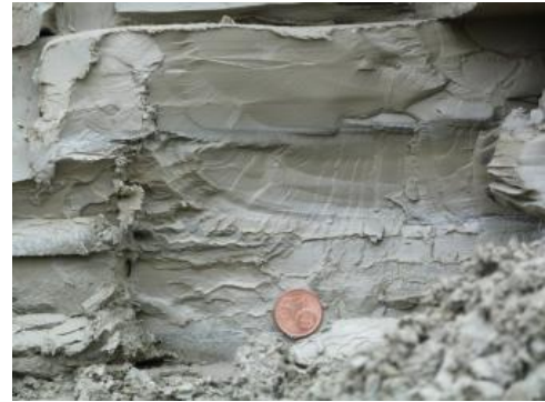
Feinlaminiertes, kompakter, mittelgrauer Bänderton

Die Abfolge besteht aus einem dunkelgrauen, stark tonigen, schwach sandigen Schluff mit einem Karbonatgehalt von 25–35 % (= Tonmergel und Mergel). Die überwiegend feinlaminierten, feinsandig-tonigen Schluffe führen z. T. 1–2,5 m mächtige Lagen aus schluffigem-tonigem Feinsand. Die Bänderung geht auf den jahreszeitlich bedingten Wechsel von hellgrauen (Frühjahrsschmelze) und dunkelgrauen (Winter, mehr organisches Material) Lagen zurück. Die Basis der nutzbaren Abfolge bilden z. T. Tonmergel der Unteren Süßwassermolasse, stark kiesige Bändertone oder Geschiebemergel. An der Basis ist vielfach eine mehrere Meter mächtige Übergangszone vorhanden, in welcher der Beckenton durch Zunahme von Geröllen allmählich in Geschiebemergel übergeht (Schreiner, 1989a).