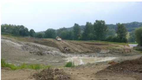
Abbau in der Tongrube Herdwangen-Schönach-Großschönach

„dropstone“-Lagen im Liegenden begrenzt.