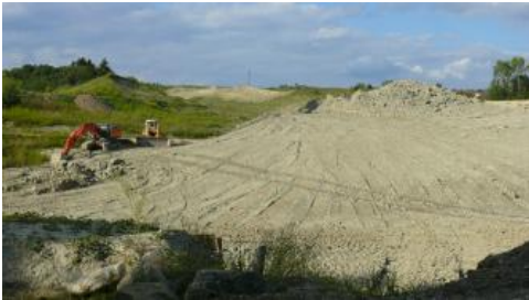
Abbau in einer Tongrube mittels Planierraupe und Löffelbagger

Gewinnung: Der Abbau erfolgt durch Bagger und Raupen , wobei schon in der Tongrube eine Homogenisierung des Materials, also das Mischen unterschiedlicher toniger und sandiger Sedimente, stattfindet. Das Beckentonvorkommen im Zeller Becken bei Rickelshausen stand lange Zeit in zwei Lehmgruben (RG 8219-327 und -328) in Abbau. Dabei musste der Grundwasserspiegel durch Pumpen abgesenkt werden. Eine Lehmgrube wurde anschließend mit Müll verfüllt, die andere ist mit Wasser gefüllt und dient heute als Fischteich.