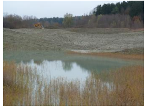
Rekultivierung einer Tongrube

Genutzte Mächtigkeit: Bei Rickelshausen wurde bis in eine Tiefe von 10 m Bänderton abgebaut. In den Tongruben Herdwangen-Schönach-Großschönach (RG 8121-1 und -2) werden 21–33 m der Abfolge genutzt.