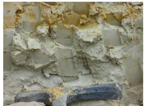
Kaolinerde mit Verbraunungshorizont

Gewinnung: Die Heuberg-Schotter werden zur Herstellung feuerfester keramischer Erzeugnisse eingesetzt. Aufgrund der heterogenen Zusammensetzung der Weißerde ist eine Homogenisierung des Materials erforderlich. In der Grube Kandern-Wollbach (Heuberg, RG 8311-1) wird die Weißerde im Schräggabbauverfahren durch eine Planierraupe homogenisiert und mit dem Bagger abgegraben. Der Abbau findet ein bis zwei Mal jährlich statt. Neben dem Aussieben der Gerölle ist keine weitere Aufbereitung des Rohstoffs nötig.