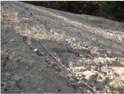
Abbauwand in den Weißerden innerhalb der Heuberg-Schotter