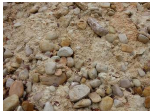
Gerölle der Heubergschotter

Die in der Grube Kandern-Wollbach (Heuberg, RG 8311-1) aufgeschlossene, ca. 12 m mächtige Ablagerung besteht aus einer stark verwitterten, gebleichten Wechselfolge aus (1) weißlichen bis gelblich rötlichen, feinsandigen bis tonigen Weißerden mit bis kopfgroßen Geröllen und (2) weißlich gelben bis grauen, stärker schluffigen, geröllfreien Lagen . Mineralische Komponenten der Weißerde sind überwiegend Kaolinit , untergeordnet Quarzsand und Feldspat . Die Weißerde besitzt eine gelblich weiße bis hellgraue Farbe. Die Zusammensetzung der genutzten Schicht ist heterogen (Tonlinsen, geröllreiche Lagen, Bereiche mit geringerem Anteil an Ton- und Schluff).