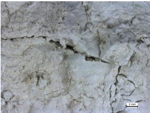
Weißerde, überwiegend aus Kaolinit, untergeordnet auch Quarzsand

Verwendung: Der Betreiber der Grube Kandern-Wollbach (Heuberg, RG 8311-1) mischt zum gewonnenen Material verschiedene andere Tone zu, um die gewünschte chemische Zusammensetzung für die Weiterverarbeitung zu erreichen. Der Großteil des zugekauften Tons stammt dabei aus dem Westerwald. Weiterhin wird dem Gemisch bereits gebrannter Ton hinzugeschlagen, um die Temperaturbeständigkeit der Produkte zu erhöhen. Aus diesem Gemisch werden Schamotte hergestellt, die vor allem zur Herrichtung von Öfen und Brennanlagen genutzt werden.