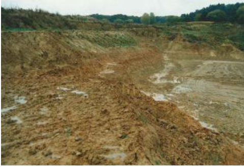
Blick nach Nordosten auf die ehemalige Tongrube Rümmingen

Geologische Mächtigkeit: Die Elsässer Molasse ist bei Lörrach fast 200 m mächtig (Geyer et al., 2011).