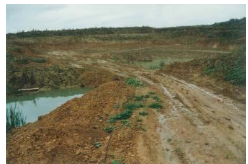
Feinsedimente der Elsässer Molasse in der Tongrube Rümmlingen

Die Elsässer Molasse ist aufgebaut aus: Mergelsteinen, Sanden und Kalksandsteinen, außerdem ist sie reich an Glimmer. In der Tongrube Rümmlingen (RG 8311-5) waren sandige, bunte Tone und Schluffe mit Kalksandsteinzwischenlagen aufgeschlossen.