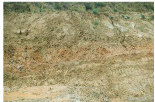
Abbauwand in der Tongrube Rümmingen

Verwendung: In der Tongrube Rümmingen (RG 8311-5) wurden bis zum Jahr 1993 Lösssedimente und Feinsedimente der Elsässer Molasse gemeinsam abgebaut und zu güteüberwachten Hintermauerziegeln verarbeitet. Wittmann (1994) berichtet, dass die harten „Laibsteine“ (= Kalksandsteinbänke) aus der Elsässer Molasse gelegentlich als Bausteine, Grenzsteine und Abdeckplatten genutzt wurden; z. T. auch als behauene Steine für Tür- und Fensterrahmen sowie als Treppensteine, Schwellen, Tröge, Schüttsteine, Platten und Fliesen.