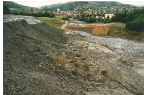
Übersicht über die ehemalige Tongrube Kandern-Ost

Genutzte Mächtigkeit: In der Tongrube Kandern-Ost (RG 8211-1) ist der Renggeriton in einer Mächtigkeit von ca. 20 m genutzt worden, zusammen mit dem überlagernden Lösslehm betrug die genutzte Mächtigkeit rund 25–30 m .