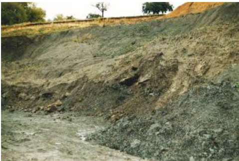
Der Anceps-Oolith trennt die Renggeritone von den Tonsteinen der Ornatenton-Formation.

Gewinnung: Der Abbau von Renggeriton erfolgte bis zum Jahr 1998 in der Tongrube Kandern-Ost (RG 8211-1); die Tongrube wurde nach Abschluss von Verfüllung und Hangsicherung im Jahr 2014 aus der Bergaufsicht entlassen. Weitere Gewinnungsstellen im Renggeriton sind im Markgräflerland nicht bekannt.