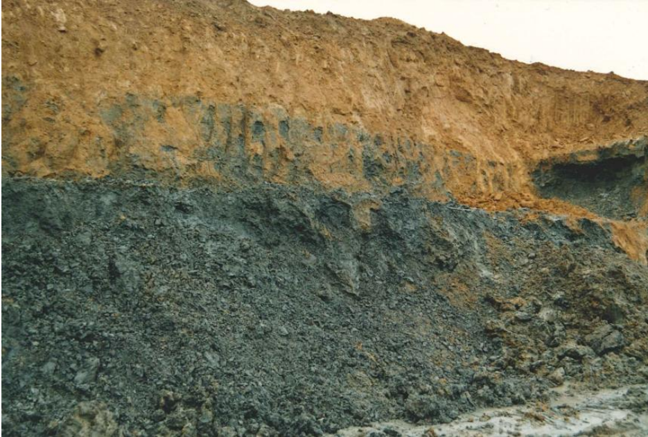
Braungelber Lösslehm über Renggeriton