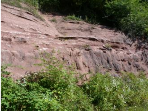
Abbauwand einer ehemaligen Abbaustelle bei Schopfheim

Geologische Mächtigkeit: Die Gesamtmächtigkeit der Weitenau-Formation erreicht in den Ausstrichgebieten um 150 bis über 200 m (Geyer et al., 2011). Die Schichtfolge zeigt eine deutliche Dreiteilung in liegende Arkose-Fanglomerat-Schichten, mittlere Schluffstein-Feinsandstein-Schichten und hangende Arkose-Schichten. Für eine Gewinnung von Ziegeleirohstoffen ist nur der mittlere Abschnitt mit den Schluffstein-Feinsandstein-Schichten von Bedeutung.