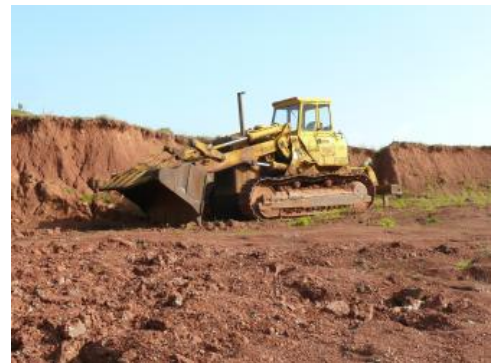
Abbau im Steinbruch Steinen-Schlächtenhaus

Verwendung: Der gewonnene Rohstoff wird zur Herstellung von Mauersteinen und Klinker verwendet. Da der Rohstoff aus der Tongrube Steinen-Schlächtenhaus (RG 8312-3) karbonatfrei ist, wird er mit anderen, karbonathaltigen Ziegeleirohstoffen (wie z. B. Lösslehm) gemischt, um die gewünschte mineralische Zusammensetzung zu erhalten.