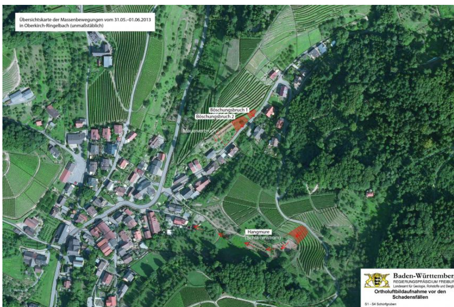
Übersichtskarte der Massenbewegungen vom 31.05.–01.06.2013

Nach vorangegangenen langanhaltenden Niederschlägen hat sich in Oberkirch-Ringelbach (Ortenaukreis) am Spätabend des 31.05.2013 (gegen 22:30 Uhr) am Nordhang des Kastelbergs oberhalb eines Wohngebäudes an der Weinbergstraße eine Hangmure ereignet. Dieses Schadensereignis steht in Kontext mit einer ganzen Reihe von in dieser Zeit in Baden-Württemberg aufgetretenen Massenbewegungen, bei denen nach mehreren regenreichen vorangegangenen Monaten zwischen 31.05.2013 und 01.06.2013 noch größere Niederschlags-Einzelereignisse folgten.