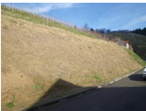
Sanierte Böschung an der Schelzbergstraße (Böschungsbruch 1 und 2)

Im Bereich des Böschungsbruchs 2 wurden insgesamt vier Spanndrahtmessstellen im labilen Hangabschnitt installiert, um bis zur Folgeweche entscheiden zu können, ob die momentanen Kriechbewegungen soweit abgeklungen waren, dass man an weitere Sicherungsmaßnahmen denken konnte. Bis dahin blieb die Evakuierung der Gebäude aufrecht erhalten. Die Messungen der Spanndrahtmessstrecken durch die Feuerwehr Oberkirch zeigten, dass sich der labile Hangabschnitt nach Ende der Niederschläge und Abtrocknen der Hangoberfläche nicht mehr weiter bewegt hat.