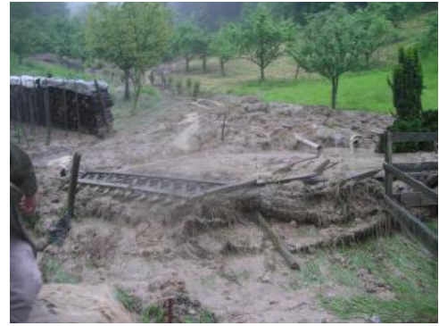
Von Schlammmassen überschütteter Wassergraben sowie zwei Fischteiche oberhalb des Wohngebäudes an der Weinbergstraße

Am Abend des 01.06.2013 (gegen 19:30 Uhr) erfolgte ein weiterer Notruf der Feuerwehr Oberkirch. An der Schelzbergstraße in Oberkirch-Ringelbach hat sich in der Straßenböschung ein weiterer großer Böschungsbruch (Böschungsbruch 1) ereignet, der die gesamte Straße in einer Höhe bis zu 1,5 m verschüttet hat. Durch diesen Böschungsbruch wie auch durch die vorangegangene Hangmure wurden einige Wohngebäude in Oberkirch-Ringelbach vom Verkehr völlig abgeschnitten. Nach erneutem Vor-Ort-Termin am Abend des 01.06.2013 wurde entschieden, drei weitere Häuser an der Schelzbergstraße zu evakuieren. Südwestlich des Böschungsbruchs von 19:30 Uhr zeichnete sich ein weiterer Abriss in der Böschungskrone ab (Böschungsbruch 2), welcher es zunächst unmöglich machte, etwaige Stabilisierungsmaßnahmen im Hang (z. B. Anlage von Sickerstützscheiben zur gezielten Hangentwässerung) einzuleiten.