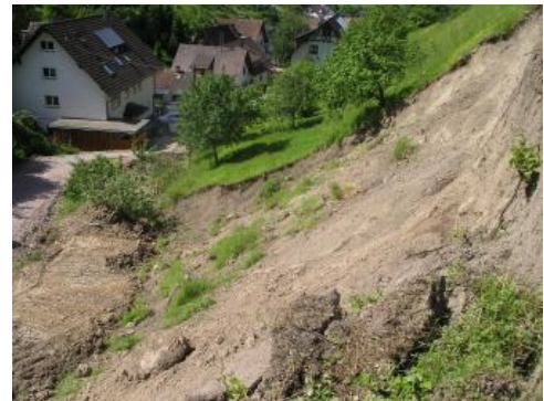
Böschungsbruch an der Schelzbergstraße. Links im Bild ist die provisorische Notfallüberfahrt zu sehen.

Die Schelzbergstraße musste nach Eintritt des Böschungsbruchs 1 umgehend für den Durchgangsverkehr gesperrt werden. Über den Fuß der Ablagerungsmassen wurde eine „Notfallüberfahrt“ für etwaige Krankenwagen- oder Feuerwehrrettungseinsätze eingerichtet, damit die aufgrund des Böschungsbruches nicht mehr erreichbaren Wohngebäude angefahren werden konnten. Dabei durften die noch wassergesättigten Rutschmassen nicht angeschnitten oder durch dynamische Lasten beansprucht werden. Bei der Herstellung der „Notfallüberfahrt“ wurde der Hang kontinuierlich visuell überwacht. Die „Notfallüberfahrt“ war nur für etwaige Einsatzkräfte gedacht, andernfalls hätte man alle übrigen eingeschlossenen Gebäude evakuieren müssen.