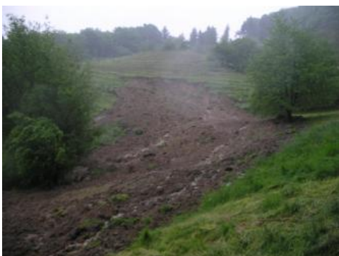
Hangmure oberhalb der Weinbergstraße

Die Abrissnische der Hangmure befand sich im hangaufwärts angrenzenden Rebgelände unmittelbar unterhalb des Schelzbergweges, hatte eine lichte Höhe von geschätzt 8 m und eine Breite von mindestens 10 m. Von dort ausgehend haben sich völlig wassergesättigte Erdmassen (geschätztes Volumen ca. 500 m 3 ) bis in den unterhalb verlaufenden Wassergraben bewegt, talwärts zwei Fischeiche oberhalb des Wohngebäudes an der Weinbergstraße verfüllt und haben sich hangseits der Garage/Terrasse eines Wohngebäudes an der Weinbergstraße angestaut.