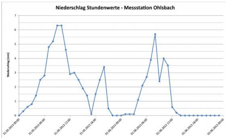
Niederschlagsaufzeichnungen der benachbarten Wetterstation Ohlsbach vom 31.05.–01.06.2013 – Stundenwerte (Messwerte des DWD)