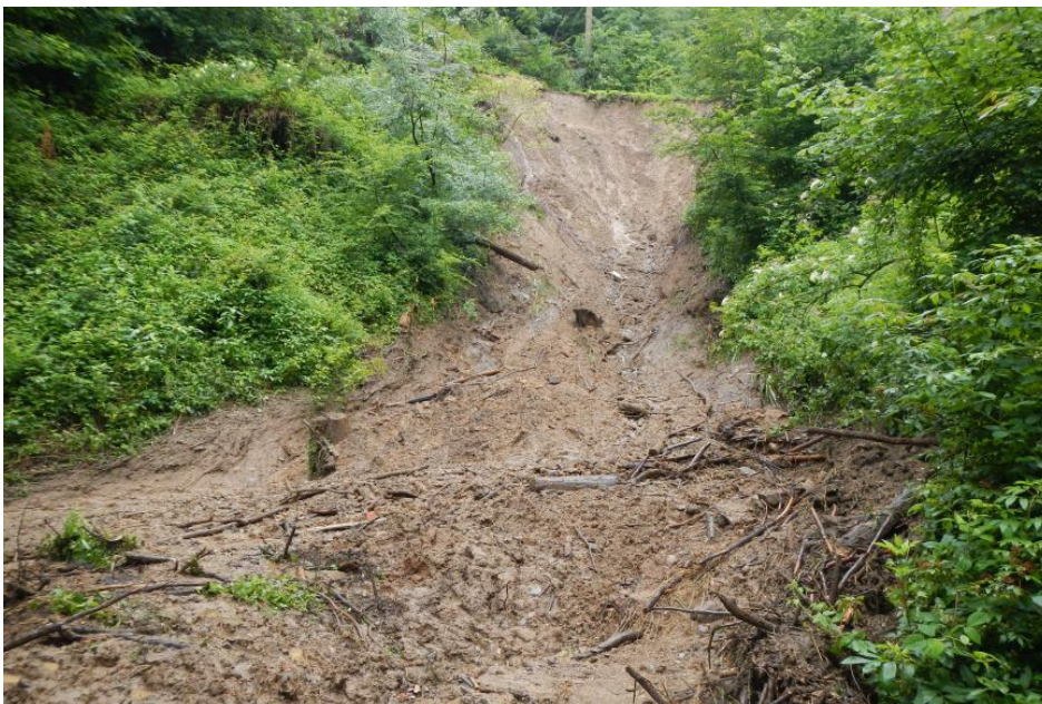
Hauptabriss in der Hangklinge unterhalb des Oberen Galgenwegs