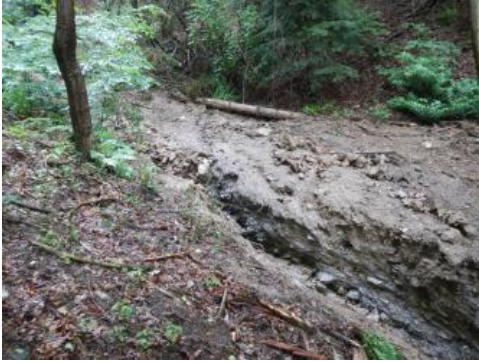
Linienhafte Erosion des Murgangs

Die im Bereich der Klinge verlegte Dole konnte das während des Starkregens abfließende Oberflächenwasser nicht mehr vollständig aufnehmen. Ein Teil des Oberflächenwassers strömte über den Forstweg in die Klinge. Vermutlich führte eine Verkettung äußerer Umstände zur Mobilisierung der aufgesättigten Bodenmassen, so dass diese als Murgang dem Gerinne folgend talwärts verlagert wurden. Als Auslöser des Murgangs wird die Unterspülung der Dammböschung des Forstwegs durch das aus der Dole austretende Wasser sowie die Überströmung der Dammböschungskante angesehen. Aufgrund der für Murgänge charakteristischen hohen Dichte des Feststoff-Wasser-Gemischs wurde die Klinge linienhaft bis zu 2 m tief erodiert. Dabei wurden auch größere Steine sowie Äste mitgerissen.