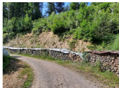
Ansicht des Oberen Galgenwegs nach bergseitiger Wegverlegung und Instandsetzung

Vor Ort hat das LGRB als langfristige Sanierungsmaßnahme des Abrissbereichs am Oberen Galgenweg einen ertüchtigten Wiederaufbau des Wegs nach dem Prinzip der „bewehrten Erde“ empfohlen. Eine bergseitige Verlegung des Oberen Galgenwegs wurde vom LGRB nicht favorisiert, da dies zu mächtigen Hanganschnitten führen würde, die ohne zusätzliche Sicherungsmaßnahmen das Risiko weiterer Instabilitäten erhöhen würde. Zur Ausführung kam schließlich dennoch eine bergseitige Wegverlegung unter Inkaufnahme etwaiger zukünftiger Instabilitäten (wie z. B. lokale Lockergesteinsumlagerungen, gehäufte Steinschlagereignisse etc.). Dieser Gefährdung wurde durch eine risikomindernde ingenieurbioologische Bestockung des Oberhangs begegnet.