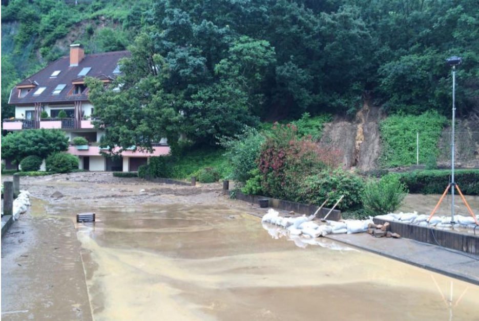
Straße Unteres Amtsfeld in Waldkirch nach dem Murgang vom 13.06.2016