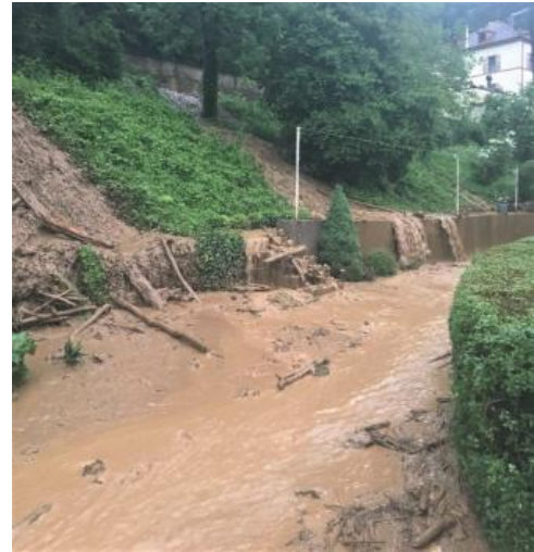
Straße Unteres Amtsfeld in Waldkirch nach dem Murgang vom 13.06.2016

Nach lokalen Starkniederschlägen ereignete sich am Nachmittag des 13.06.2016 in einer Klinge im Staatswald Waldkirch südwestlich des Bruder-Klaus-Krankenhauses ein Murgang, der die Straße Unteres Amtsfeld bereichsweise verschüttete. Wegen der Gefahr weiterer Murgänge mit möglichen Gebäudeschäden wurden die Bewohner mehrerer Wohnhäuser im Unteren Amtsfeld bis zum Folgetag vorsorglich evakuiert.