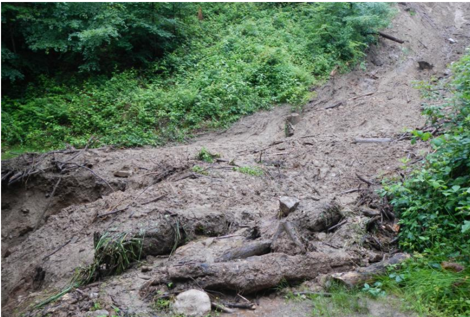
Ablagerung des Murgangs im Bereich des Unteren Galgenwegs

Die im Bereich der Klinge verlegte Dole konnte das während des Starkregens abfließende Oberflächenwasser nicht mehr vollständig aufnehmen. Ein Teil des Oberflächenwassers strömte über den Forstweg in die Klinge. Vermutlich führte eine Verkettung äußerer Umstände zur Mobilisierung der aufgesättigten Bodenmassen, so dass diese als Murgang dem Gerinne folgend talwärts verlagert wurden. Als Auslöser des Murgangs wird die Unterspülung der Dammböschung des Forstwegs durch das aus der Dole austretende Wasser sowie die Überströmung der Dammböschungskante angesehen. Aufgrund der für Murgänge charakteristischen hohen Dichte des Feststoff-Wasser-Gemischs wurde die Klinge linienhaft bis zu 2 m tief erodiert. Dabei wurden auch größere Steine sowie Äste mitgerissen.