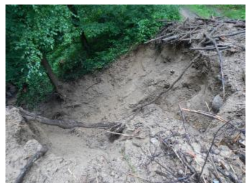
Erosion des Murgangs im Bereich des Unteren Galgenwegs

Zum Talboden hin kam es durch die Abnahme des Gefälles und der Fließgeschwindigkeit am Hangfuß zur Ablagerung des Murgangmaterials (Ablagerungsbereich) und somit zur Verschüttung der bergseitigen Grundstücke und angrenzenden Straße. Die Murgangzunge reichte bis zur Straße Unteres Amtsfeld etwa 200 m vom Hauptabriss entfernt und ca. 75 Höhenmeter tiefer.