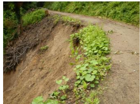
Hauptabriss in der Hangklinge unterhalb des Oberen Galgenwegs

Der Murgang ereignete sich in einer Klinge etwa 180 m südwestlich des Bruder-Klaus-Krankenhauses. Der etwa 20 m breite, sichelförmige Hauptabriss befindet sich auf etwa 335 m ü. NHN unmittelbar unterhalb bzw. am talseitigen Rand des Forstwegs Oberer Galgenweg, war etwa 44–48° steil und rund 8,5–12,5 m hoch. An der Basis des Hauptabrisses trat Wasser aus. Nach Auskunft der Forstverwaltung war nach dem Murgang in diesem Bereich zunächst der anstehende Fels aufgeschlossen, welcher jedoch rasch durch nachgerutschtes Lockergestein wieder verdeckt wurde.