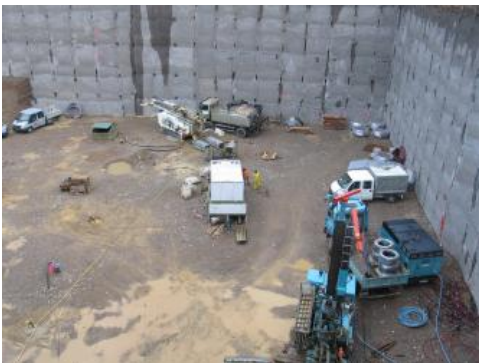
Errichtung eines Erdwärmesondenfeldes in einer Baugrube. Die einzelnen Erdwärmesondenrohre ragen aus der Baugrube heraus.

Durch unsachgemäße Ausführung der Erdwärmesondenbohrungen und der Ringraumabdichtung kam es in der Vergangenheit u. a. in Baden-Württemberg zu gravierenden Schadensfällen mit weit reichenden Folgen.