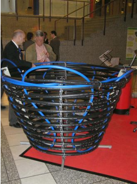
Beispiel für einen kleineren Erdwärmekorb

Bei Erdwärmekörben sind die Sondenrohre kegelförmig gewickelt. Die Körbe haben i. d. R. eine Höhe von 1,5 bis 3 m und werden je nach Größe in Tiefen von bis zu 4,5 m eingebracht. Ein wesentliches Element der Funktion der Erdwärmekörbe ist die Phasenverschiebung der Untergrundtemperatur im Jahresgang, bei der die höchsten Temperaturen im Untergrund zu Beginn der Heizperiode erreicht werden und die niedrigsten Anfang Sommer. Bei kleineren Körben geht man von einer durchschnittlichen Entzugsleistung von etwa 0,5 kW aus (BHD, 2011). Größere Erdwärmekörbe können Entzugsleistungen von 1,5–2,0 kW aufweisen. Für die Beheizung eines Einfamilienhauses sind daher i. d. R. mehrere Erdwärmekörbe erforderlich und somit ein entsprechend großer Flächenbedarf.