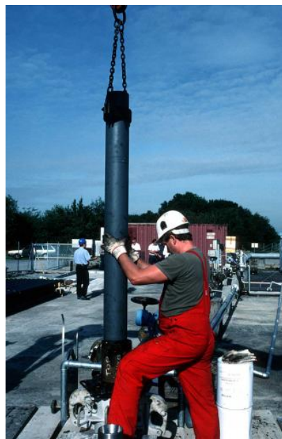
Pumpeneinbau in eine Tiefbohrung, hier: Bruchsal