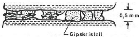
Gipskristalle in den Schichtfugen (Grafik: Veas, 1987)

Diese drücken die zahlreichen dünnen Gesteinsschichten auseinander, woraus schließlich eine Hebung des Untergrunds resultiert.