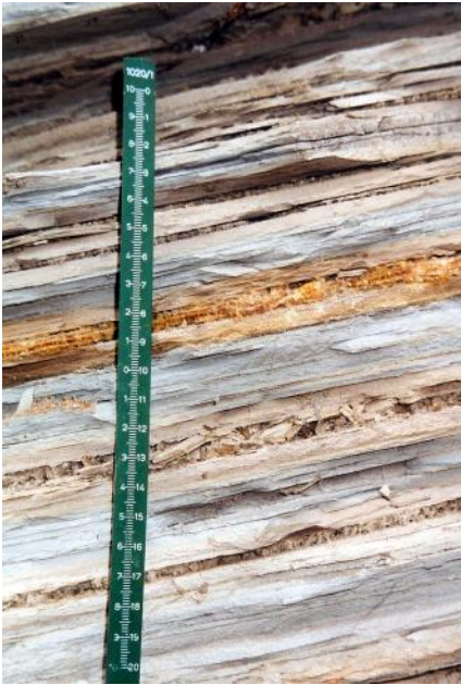
Schichtflächen mit Gipskristallrasen

Die bislang bekannten maximalen Hebungsbeträge liegen bei 60 cm. Die Schadensentwicklung setzt u. U. erst zehn Jahre nach Fertigstellung eines Gebäudes ein. Die Hebungsvorgänge können, wenn ausgelöst, Jahrzehnte andauern. In einem, dem LGRB bekannten Fall kam es auch zu Hebungen des Fußbodens, unter dem gebrochenes Ölschiefergestein als verdichtete Ausgleichsschicht eingebaut wurde.