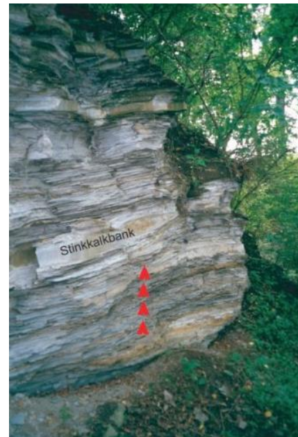
Durch Gipskristallisation deformierter Ölschieferstoß

Diese Phänomene treten sowohl in Zusammenhang mit Überbauungen als auch natürlich auf. So ist z. B. am Westrand der Schwäbischen Alb, südwestlich von Dotternhausen (Zollernalbkreis) ein Felsaufschluss der Posidonienschiefer-Formation zu sehen, bei dem sich natürlich auf unzähligen Schichtflächen ein 0,5–3 mm starker Gipskristallrasen gebildet hat. Aufgrund des Kristallisationsdrucks wurde der Schieferstoß auseinandergetrieben und entsprechend angehoben.