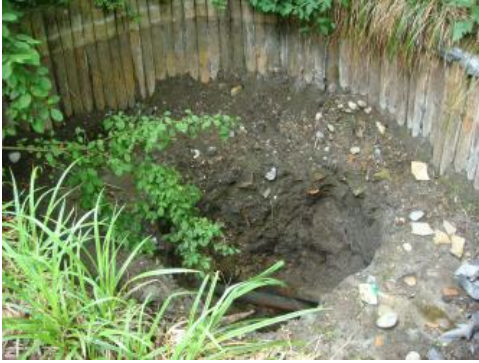
Trockengefallenes Biotop der Rainbrunnenquelle/Schorndorf

Kurze Zeit später wurden am Pavillongebäude der Keplerschule sowie an Häusern und Garagen im umgebenden Wohngebiet neu aufgetretene Risse beobachtet. Außerdem fiel eine nicht weit entfernte und seit etwa 30 Jahren bestehende Grundwasserwärmepumpe, die das Grundwasser der Grabfeld-Formation direkt nutzte, trocken.