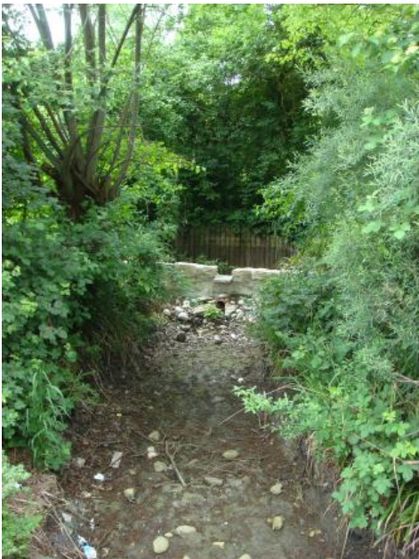
Versiegter Quellauslauf der Rainbrunnenquelle/Schorndorf

Im nordwestlichen Stadtgebiet von Schorndorf wurden im Oktober 2008 in der Nähe der Keplerschule zwei 115 Meter tiefe Bohrungen abgeteuft und zu Erdwärmesonden ausgebaut. Wenige Tage nach Abteufen der Bohrungen versiegte die aus den Talablagerungen artesisch austretende Rainbrunnenquelle auf dem Gelände der Keplerschule. Dies hatte zur Folge, dass auch das von der Quelle gespeiste Biotop trocken fiel.