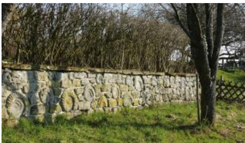
Gartenmauer aus Arietenkalk

Das Brechen der Steine war ursprünglich den Landwirten vorbehalten, die dadurch im Winter eine Betätigung und Einkommen hatten. Die gebrochenen und bearbeiteten Kalksteine wurden zu Mauern, z. T. mit eingesetzten Ammoniten, verbaut, wie sie heute noch in Schwäbisch Gmünd-Kleindeinbach und -Oberbettringen zu finden sind. Die Schulhofumfassungsmauer der Klösterleschule in Schwäbisch Gmünd zeigt, welche Massen an Fossilien im Arietenkalk erhalten sein können. Die Kalksteine des Arietenkalks wurden weiterhin als Sockelgemäuer von Privathäusern in Straßdorf, Herlikofen und in Schwäbisch Gmünd verbaut.