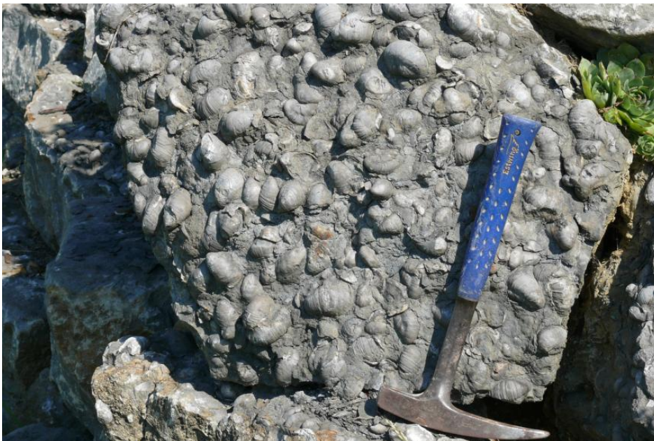
Zusammenschwemmung von Muscheln der Art Gryphaea arcuata auf einer Schichtfläche im Arietenkalkstein

Der Arietenkalk besaß im Ausstrichbereich der nach ihm benannten geologischen Formation über Jahrhunderte hinweg vor allem als Bau- und Pflasterstein Bedeutung. In über 100 Steinbrüchen wurde er gebrochen. Großformatige Werksteinblöcke sind aus ihm nur selten zu gewinnen. Heute wird er nirgends mehr abgebaut. Die Sedimentgesteine der Arietenkalk-Formation (juAK) erstrecken sich in Baden-Württemberg von Donaueschingen im Südwesten bis Aalen im Nordosten. Zwischen Donaueschingen, Balingen und Reutlingen ist die Ausstrichbreite relativ gering, nimmt in östliche Richtung dann aber deutlich zu. Über Nürtingen, Göppingen und Schwäbisch Gmünd erreicht sie aufgrund der söhlig Lagerung ca. 20 km und nimmt bei Aalen schließlich wieder ab. Östlich von Aalen wird der Arietenkalkstein zunehmend sandiger, was zu einem mittel- bis grobkörnigen Kalksandstein führt, der als Gryphäensandstein im Raum Aalen-Ellwangen eine eigene Formation bildet. Die Mächtigkeit der Sedimentgesteine der Arietenkalk-Formation beträgt meist nur 3–7 m, im Großraum Stuttgart nimmt sie auf 17–19 m zu. Die für Bau- und Werksteine nutzbaren Abschnitte sind meist nur 1,4–3,3 m mächtig, im Schnitt 2,3 m (Reyer, 1927).