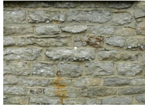
Detailaufnahme aus einer Arietenkalkmauer

Einer der Hauptverwendungszwecke des Arietenkalks nach 1945 war der Straßen- und Wegebau. In der Region um Schwäbisch Gmünd wurden die Gesteine in den Steinbrüchen bei Straßdorf, Wetzgau, Bettringen und Herlikofen gewonnen. Kalksteine, welche nach der Sprengung gerade Seiten aufwiesen, fanden Verwendung als Mauer und Sockelsteine, der Rest als Vorlagesteine. Sie bildeten das Grundgerüst der Straßen und Wege und wurden mit einer Schicht aus Hartsteinschotter bei höherwertigen Straßen und Splitt im Fall von Wegen bedeckt. Anfang der fünfziger Jahre ging die Nachfrage nach Arietenkalk zurück, er wurde durch härtere Gesteine ersetzt (Mayer, 2010). In Schwäbisch Gmünd wurde er beispielsweise 1960 zum letzten Mal für Vorlagesteine genutzt. Nach LGRB (2001a) wurden die Arietenkalkbrüche nach der Einführung der Asphalt- und Betondecken im Straßenbau aufgegeben und verfüllt.