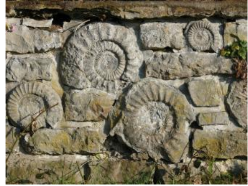
Mauer mit Ammoniten der Gattung Arietites

Die Bezeichnung „Arietenkalk-Formation“ geht auf Ammoniten der Gattung Arietites zurück, welche in großer Zahl und oft beachtlicher Größe in den Kalksteinen dieser Formation auftreten können. Die Kalksteine sind reich an Schalenresten und Echinodermenbruchstücken. Die Muschel Gryphaea arcuata kommt auf der Ostalb teilweise so massenhaft vor, dass sie als gesteinsbildend bezeichnet werden kann. Darauf ist der Name „Gryphäenkalk“ oder „Gryphitenkalk“ zurückzuführen. Im Volksmund wird der Kalkstein aufgrund der Ammoniten und Muscheln auch „Schneckenfels“ oder „Uhrenfels“ genannt; bei Gmünd führt er den Namen „Liasfels“ (Reyer, 1927).