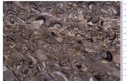
Schnitt senkrecht zur Schichtung durch einen Arietenkalksteinblock

Nach Frank (1949) wurden die Arietenkalke im Albvorland überwiegend für Straßenbausteine verwendet. Örtlich wurden sie aber auch zum Bau von Hausmauern und rohen Feldmauern genutzt. Bei Trossingen, Spaichingen und Göppingen wurden sie zum Kalkbrennen gewonnen. Auch Reyer (1927) berichtet von der Herstellung von schwarzem Kalk, von Straßenschotter und Pflastersteinen. Beim Abbau von Arietenkalk zusammen mit dem Angulatensandstein in der Umgebung von Stuttgart-Vaihingen (Reyer, 1927) wurden von oben nach unten drei brauchbare Felsen von den Pflasterern unterschieden und mit folgenden Namen belegt: Straßenschotterfels, Galle und Pflastersteinfels. Bei der Galle handelt es sich um einen sehr harten, dichten und festen Kalkstein mit Echinodermen- und Muschelschalenresten. Nach Mayer (2010) erhielten die drei Hauptbänke des Arietenkalks im Raum Schwäbisch Gmünd von den Steinbrechern die Namen Dreispälter (Gryphäenbank), Schneckenfels sowie unterer und oberer Schneller.