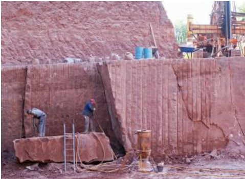
Sandsteingewinnung im Steinbruch Dietenhan

Im seit fast 100 Jahren bestehenden Steinbruch Dietenhan (RG 6223-1) beträgt die genutzte Mächtigkeit im obersten Teil des Plattensandsteins derzeit ca. 5–7 m (Stand Juli 2009). Die Gesamtmächtigkeit der Werksteinzone betrug im früher genutzten, bereits wieder verfüllten Ostteil des Steinbruchs maximal 10–13 m. Im Liegenden des im Augenblick abgebauten Sandsteinkörpers folgt nach Erkundung des Betreibers nochmals ein mehrere Meter mächtiger, vermutlich teilweise werksteinfähiger Sandstein. Der etwas über 20 m mächtige Abraum besteht aus den Unteren Röttonen, in die sich wiederholt dickere, teilweise quarzitisches gebundene Sandsteinlagen einschalten. Infolge des starken Abtauchens der Schichten nach WNW bis NW zwischen Kembach und Dietenhan (Freudenberger, 1990) nimmt die Abraummächtigkeit im hangparallelen, W–O-orientierten