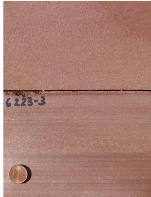
Gesteinsplatten von Rotem Mainsandstein aus dem Oberen Buntsandstein

Die für die Werksteingewinnung genutzten Bereiche sind mittel- bis dickbankig, teilweise sogar massig; insbesondere lateral, aber auch vertikal gehen sie, z. T. auf kurzer Distanz, in Wechselfolgen aus Sandsteinen (z. T. dünn-/mittelbankig und auch plattig) und aus bis zu mehrere dm mächtigen Ton-/Schluffsteinlagen über (Bock et al., 2005a). Diese Partien sind für eine Werksteingewinnung weitgehend ungeeignet. Die zur Werksteingewinnung genutzten Bänke weisen Kluffabstände von mehreren Metern auf und gestatten somit die Gewinnung großer Blöcke.