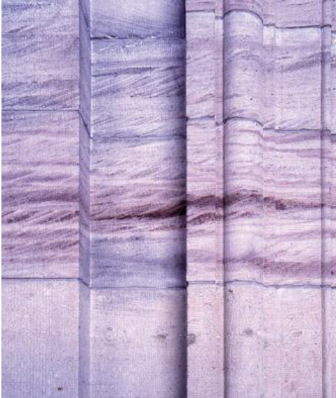
Mauerwerk des Portalgebäudes des Doms in St. Blasien

Ausflug nach St. Blasien: Die Pfarrkirche St. Blasius, wegen ihrer großen Kuppel auch als „Schwarzwälder Dom“ bezeichnet, war einst Kirche einer bedeutenden Benediktinerabtei, deren Gründung auf das 9. Jh. zurückgeht. 1768 wurden durch einen Großbrand das Kloster und die barocke Klosterkirche weitgehend vernichtet. Schon 1772 wurde mit dem Wiederaufbau begonnen, und bereits 1783 war der 62 m hohe Dom St. Blasius, ein Meisterwerk des Frühklassizismus, fertig gestellt. Die monumentalen Gebäude des Klosters und der Kirche sind in Massivbauweise aus grobkörnigem Buntsandstein errichtet, der durch seine helle Färbung und ausgeprägte Strukturierung mit Schrägschüttungskörpern und schichtparallelen Eisen-Manganbändern auffällt. Die Farbpalette des kieselig gebundenen, harten und sehr witterungsbeständigen Sandsteins reicht von fast weiß, grauweiß über hellgelblich, hellbräunlich gelb bis hellrot. Charakteristische Erkennungsmerkmale für die Herkunftslagerstätte im 20 km entfernten Unteralpfen sind neben dem vorherrschenden gelblich weißen Ton die durchweg grobe Körnung und der hohe Anteil an Quarzfeinkies. Regellos verteilt sind kantige Gerölle in Mittel- bis Grobkiesfraktion aus Milchquarz, rotem Hämatitquarz und schwarzen Kieselschiefern. Beeindruckend sind auch die Blockgrößen. Zum Bau der vier freistehenden und zwei eingemauerten dorischen, 15 m hohen Säulen