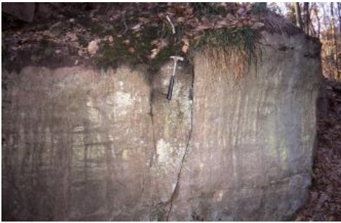
Hauptbank in den aufgelassenen Steinbrüchen bei Degerfelden

Lage, Geologie: Buntsandstein tritt in der Umgebung von Degerfelden, nordwestlich von Rheinfeldern (Baden), in einem tektonischen Aufbruch innerhalb eines nur knapp 1 km 2 großen Gebiets in einer sonst vom Muschelkalk geprägten Landschaft zu Tage (Geol. Karte Blatt 8412 Rheinfeldern; Laske & Sawatzki, 2000b). Über sandig-tonigen Schichten des Rotliegenden ist die hier ca. 30–40 m mächtige Schichtenfolge aus Sand-, Silt- und Tonsteinen des Buntsandsteins an drei steilen Talhängen aufgeschlossen. Die sich über viele Hundert Meter hinziehenden, 20–30 m hohen Brüche sind an der Ostseite des Eichbergs (früher auch „Steingrubenberg“; s. Birlin, 1994), an der Westseite des Nettenbergs und an den steilen Nord- und Südosthängen des Hirzenteck-Plateaus bei Degerfelden (auch „Hertener Berg“) sowie südlich des Katzenstiegs, 1 km westnordwestlich des Ortsausgangs von Degerfelden, erhalten. Weitere Brüche liegen am Südrand von Inzlingen etwa 4,5 km westnordwestlich von Degerfelden. Die Steinbrüche sind in Schichten des Mittleren Buntsandsteins angelegt, reichen aber oft auch bis in den Oberen Buntsandstein hinauf.