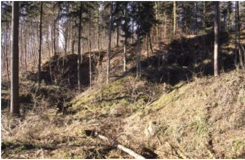
Historische Steinbrüche im Oberen Buntsandstein nördlich von Schopfheim

Lage, Geologie, Gesteinsbeschreibung: Nordöstlich von Gündenhäusern bzw. 0,5–1 km nordwestlich der Schopfheimer Kernstadt, im Bereich der Gewanne Gehaid und Stalden, liegen ein Dutzend alter, überwachsener Sandsteinbrüche im Mittleren bis Oberen Buntsandstein. Sie sind auf der TK 25 (Ausgabe 1998) zu sechs größeren Brüchen zeichnerisch zusammengefasst worden. Diese vermutlich seit gut hundert Jahren nicht mehr betriebenen Brüche weisen wie in Degerfelden in Bezug auf den Schiffstransport eine besonders verkehrsgünstige Lage auf; nur wenige Hundert Meter entfernt verläuft die Wiese, ein nach der Schneeschmelze schiffbarer Schwarzwaldfluss, der bei Weil am Rhein in den Strom mündet. Die alten Transportwege im steilen Waldgelände, mit einem gleichmäßigen Gefälle von wenigen Grad angelegt, sind heute noch erhalten. Auf