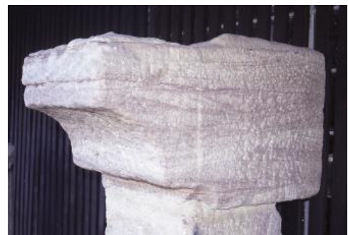
Balkenwiderlager aus grobkörnigem, schräg geschichtetem Degerfelder Sandstein

Gewinnung: Der Degerfelder Buntsandstein wird seit der Antike für große Bauwerke genutzt. Er ist z. B. in den römischen Ausgrabungen von Augusta Raurica (Balkenwiderlager), im Badegebäude von Badenweiler und in den Fundamenten des römischen Castrum am Breisacher Münsterbergs anzutreffen (Werner, 2005, 2008). Nach Rentzel (1998, S. 190) sind unter den aus Sandstein gefertigten Arbeiten der „grobkörnige Mittlere Buntsandstein vom Nettenberg“ bei Degerfelden und auch der „homogene, feingeschichtete Buntsandstein“ die am häufigsten verwendeten antiken Werksteine in August bzw. Augusta Raurica (Der häufigste römische Baustein in Augusta Raurica und dem benachbarten Castrum war der dickplattig brechende Muschelkalk, der nach Rentzel aus Basel, Grenzach und flussnahen Brüchen in Kaiseraugst stammt). Der genannte feingeschichtete, tiefrote Sandstein kann sowohl aus dem Oberen Buntsandstein von Degerfelden als auch von Schopfheim (s. u.) stammen. Der Transportweg von den Degerfelder Brüchen zum Hochrhein betrug nur 2–3 km, bis nach Augusta Raurica südlich der heutigen Ortschaft Kaiseraugst nur max. 4,5 km. Eine römische Brücke führte von einem am Nordufer gelegenen Brückenkopf in das Castrum Rauracense; sie dürfte ebenso für Steintransporte genutzt worden sein wie der unmittelbare Schifftransport in den Hafen der Römerstadt.