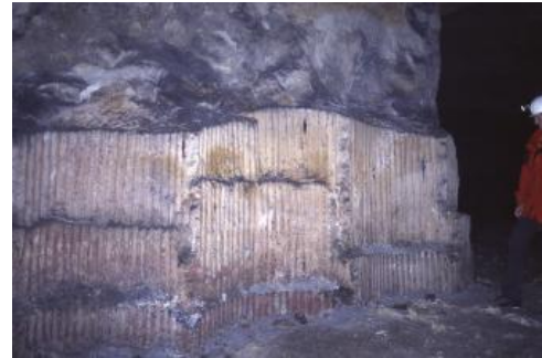
Mülsteinbank im Mülsteinbergwerk „Bleiche“ im Liederbachtal bei Waldshut

Tabelle: Chemische Zusammensetzung der Mülsteinbank im Oberen Buntsandstein aus dem nördlichen Stollen im Schmitzinger Tal und einem Bergwerk im Liederbachtal bei Waldshut, nach Metz (1980, S. 560); alle Angaben in M.-%