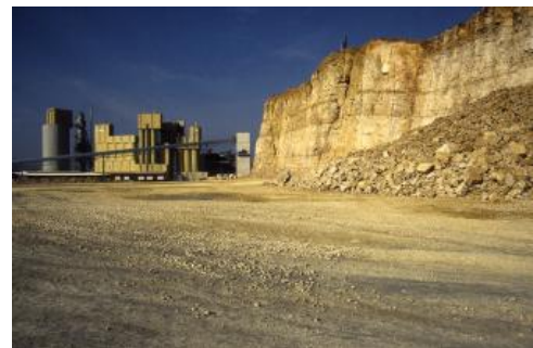
Steinbruch Merdingen mit frisch gesprengtem Haufwerk, im Hintergrund das Kalkwerk

Dahl (2006) führte einaxiale Druck- und Spaltzugversuche am Hauptrogenstein vom Tuniberg durch und entnahm hierfür aus ehemaligen Steinbrüchen und dem in Betrieb befindlichen Stbr. bei Merdingen (RG 7912-2) Bohrkerne. Es zeigte sich, dass die Druckfestigkeit im Kalkoolith insgesamt starken Schwankungen unterworfen ist: die Mittelwerte der Messreihen reichen von 51 bis 133 MPa, Einzelwerte sogar von 34 bis 153 MPa. Anders als bei deutlich geschichteten Sandsteinen treten Maximal- und Minimalwerte der Druckfestigkeit sowohl senkrecht als auch parallel zur Schichtung auf (die Druckfestigkeit kann also z. B. parallel zur Schichtung höher sein als senkrecht dazu). Die Mittelwerte der E-Module lagen zwischen 22 und 49 GPa. Nachmessungen an senkrecht zur Schichtung gewonnenen Bohrkernen aus zwei verschiedenen Kalksteinbänken erbrachten Druckfestigkeiten von 53,8–55,8 MPa und 79,5–89,8 MPa (Bissen & Henk, 2006) und somit ebenfalls signifikante Schwankungen, ohne dass am Gestein makroskopisch erkennbare Unterschiede festzustellen waren. Die Dünnschliffanalyse zeigte, dass es zahlreiche, feine Calcitneubildungen in Form von Drusen, Äderchen und Klufftapeten gibt. Sedimentäre Unterschiede spielen also eine wesentlich geringere Rolle als spätere Überprägungen durch Tektonik, Mineralisation und jungen Lösungs-transport.