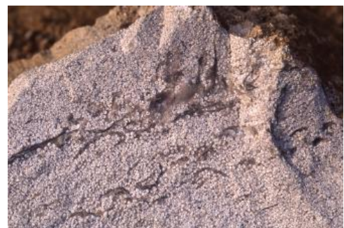
Leicht angewitterte Bruchfläche von Haupttrogenstein mit Schilllagen

Die Sedimentation der Ooidsande, aus denen der Haupttrogenstein entstand, erfolgte im Zeitraum von etwa 168 bis 165,5 Mio. Jahren (DSK, 2002). Der Untere Haupttrogenstein wird dem oberen Teil des Unter-Bajociums, der Mittlere und Obere Haupttrogenstein dem Ober-Bajocium zugeordnet (Groschopf et al., 1996). Die Kalkoide wurden in einem subtropischen Flachmeer auf ausgedehnten Barren bei einer Wasserbedeckung von nur 1–2 m gebildet (vgl. Füchtbauer, 1988; Press & Siever, 2003). Im kalkübersättigten, warmen Wasser wurden um die als Kristallisationskeime wirkenden kleinen Fossilbruchstücke konzentrische Kalkkrusten abgeschieden. Besonders an älteren Steinbruchwänden sind im Haupttrogenstein Schrägschichtungskörper gut zu erkennen; sie führen vor Augen, dass die Ooide unter dem andauernden Einfluss von Wasserströmungen abgelagert wurden (Sandbarren). Anzeichen von bewegtem Wasser sind auch die vielen Schilllagen.