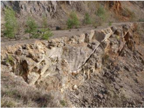
Haupttrogenstein im Steinbruch Bollschweil, südlicher Teil

Das Verbreitungsgebiet des Haupttrogensteins im südlichen Oberrheingraben ist, wie eingangs erwähnt, von ausgeprägter Bruchschollen-Tektonik gekennzeichnet. Die Schichten sind überwiegend mit 5–30° nach Westen oder Nordwesten verkippt. Aufgrund der intensiven tektonischen Beanspruchung am Grabenrand wird das Verbreitungsgebiet des Haupttrogensteins von zahlreichen Störungen durchzogen, die vor allem NO–SW-, NW–SO- und NNW–SSO-Richtung aufweisen. Die Störungen verlaufen meist in Abständen von einigen Hundert Metern, bisweilen auch in engeren Abständen. Das in den zahlreichen Steinbrüchen gut bestimmbare Klufnmuster zeigt dominant NO–SW- und dazu fast orthogonal orientierte NW–SO-verlaufende Klüfte (Köster, 2009). Beiden Bruchmustern folgend reihen sich im Bereich der Haupttrogensteintafeln Hunderte von lehrerfüllten Dolinen und Karstsenken „perlschnurartig“ aneinander.