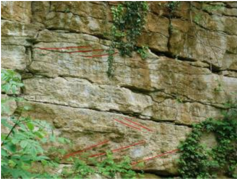
Aufgelassener Haupttrogensteinbruch südlich von Müllheim mit nach Westen einfallender Schichtung

Ein großer Teil der Haupttrogenstein-Formation ist durch die Erosion der einst über dem Schwarzwaldkristallin liegenden Sedimentdecken während des Tertiärs abgetragen worden. Aus ihrem Abtragungsschutt sind z. B. die Kalksandsteine vom Typus Pfaffenweiler und die Tertiärkonglomerate entstanden. Die maximale Mächtigkeit der nutzbaren Kalksteinpakete liegt im betrachteten Gebiet zwischen 50 und 60 m. Im Markgräflerland zwischen Staufen und Sulzburg, östlich von Müllheim sowie südlich davon bis nach Schliengen-Liel (Kreis Lörrach) gibt es zahlreiche kuppen- und tafelartige Geländerrücken, die aus einigen Zehnermeter mächtigen, nach Nordwesten gekippten Schichtpaketen von Mittlerem und Unterem Haupttrogenstein bestehen. Südlich von Müllheim weisen einzelne tektonische Schollen noch maximale Kalksteinmächtigkeiten von 70–80 m auf.