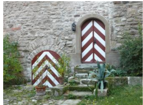
Teilweise aus Kieselsandstein bestehendes Blockmauerwerk im Schloss Honhardt bei Crailsheim

Nach Engel (1908, S. 161 f) fand für die Säulen in der Lorcher Klosterkirche Kieselsandstein Verwendung, der bei Oberurbach abgebaut wurde: „In der Umgebung von Oberurbach z. B. tritt an die Stelle des kristallisierten Sandsteins, der noch bei Plüderhausen im Lochtobel ganz typisch (mit Wellenschlägen und Afterkristallen nach Steinsalz) ansteht, mitten in den Bunten Mergeln ein weißer Sandstein auf, der in dem Steinbruch nördlich vom Gänsberg (östlich von Oberurbach, Anm. d. Verf.) in einer Mächtigkeit von fast 3 m unter dem Namen weißer Werkstein abgebaut wird und schon im Mittelalter in der Klosterkirche zu Lorch (Säulen) Verwendung gefunden hat. Er ist viel feinkörniger als der Stubensandstein und wesentlich von diesem zu unterscheiden.“ Nach Auswertung des digitalen Geländemodells (DGM) und der Geologischen Karte 1 : 25 000, Blatt 7123 Schorndorf, liegt dieser Steinbruch sehr wahrscheinlich am Südost-Hang des Gewanns „Alter Berg“ (O 543232 / N 5407805) im Oberen Kieselsandstein. Das von Silber (1922) am Gänsberg beschriebene, nicht mehr genau zu lokalisierende Kieselsandstein-Profil mit einem nur 0,6 m mächtigen weichen gelblichen Feinsandstein korrespondiert nicht mit der Beschreibung von Engel.