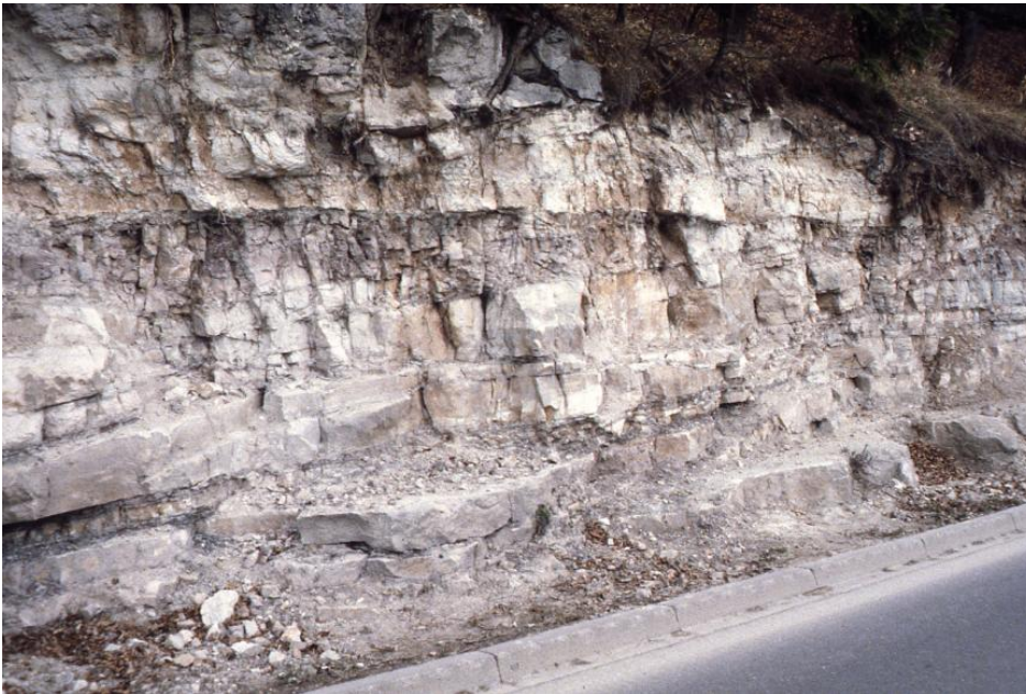
Aufschluss im Kiesel sandstein bei Jagstzell