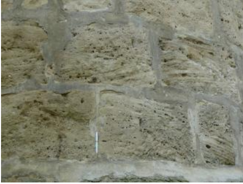
Typischer Blasensandstein im Blockmauerwerk des Turms der Tannenburg bei Bühlertann

Verwendung: Die Sandsteine der Kieselsandstein-Formation wurden früher bei genügender Zementation als anspruchsloser Baustein oder als Schotter und Vorlagestein genutzt. Zur Werksteingewinnung sind vor allem die kieselig gebundenen Sandsteine geeignet. Aufgrund der stark schwankenden Mächtigkeitsverhältnisse (s. o.) sind werksteinfähige Horizonte innerhalb der Kieselsandstein-Formation recht selten (Bräuhäuser, 1912). Bei fortgeschrittener Entfestigung wurden die Mürbsandsteine zu Sand aufbereitet (Quenstedt, 1869a, 1880a). In der Karte sind die in der Rohstoffgewinnungsstellendatenbank des LGRB erfassten 70 früheren Abbaustellen im Kieselsandstein, unterschieden nach Sand- und Natur(werk)steingewinnung, dargestellt. Danach liegen die meisten Werksteinbrüche im Gebiet zwischen Backnang und Schwäbisch Hall, also im Bereich der ehemaligen Schwemmebene. Quenstedt weist für