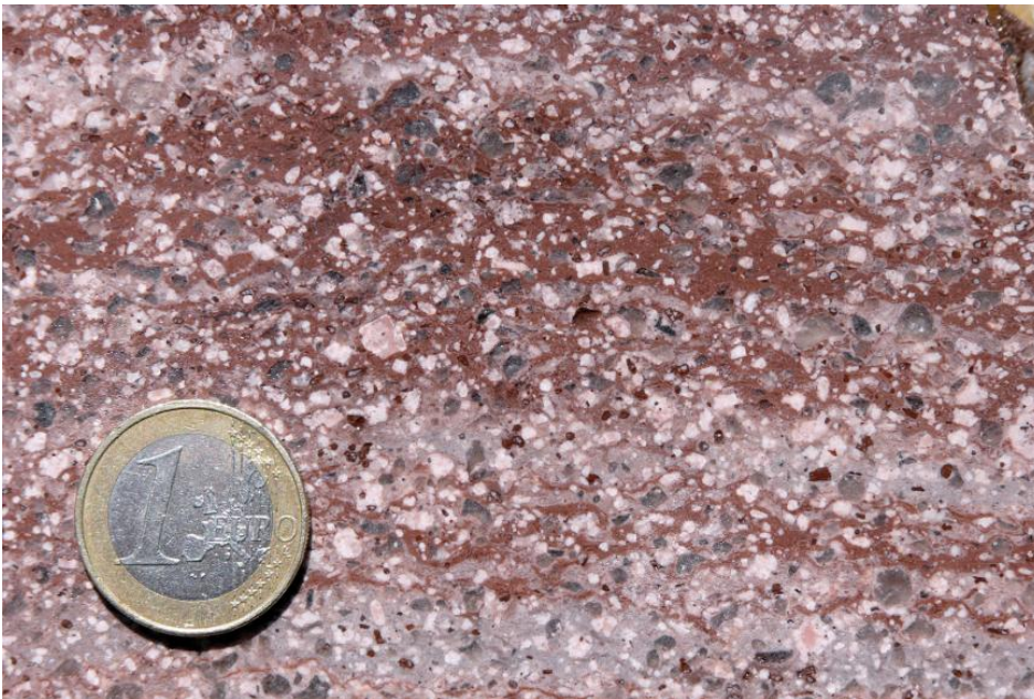
Platte aus Leisberg-Porphyr aus dem stillgelegten Steinbruch Baden-Baden

Der Leisberg-Porphyr ist ein roter bis hellvioletter, porphyrischer Rhyolith. Das stellenweise gebleichte Gestein zeigt eine plattige bis bankige Ausbildung, die auf eine Ablagerung in Deckenergüssen oder Lavaströmen schließen lässt. Die dichte feinkristalline Grundmasse enthält 1–5 mm große Einsprenglinge aus Feldspat und Quarz, seltener tritt Pinit und Biotit auf. Mikroskopische Untersuchungen von Maus (1967) erbrachten, dass das Gestein aus 15–19 Vol.-% Feldspat, 5–12 Vol.-% Quarz, 1–3 Vol.-% Pinit, 0–1 Vol.-% Biotit und 70 Vol.-% Grundmasse besteht. Die Kristalle der Einsprenglinge zeigen meist xeno- bis hypidiomorphe Formen. Feldspateinsprenglinge besitzen eine weißlich gelbe Färbung, die von einer Serizitisierung herrührt. Hierdurch werden die Feldspäte verwitterungsanfällig, und es bleiben auf der Verwitterungsoberfläche kleine rechteckige Vertiefungen im Gestein zurück. Die grauen Quarzkristalle weisen meist eine gerundete Form auf, die auf eine Korrosion der Einsprenglinge in der Schmelze zurückzuführen ist. Geochemisch handelt es sich beim Quarzporphyr in der Senke von Baden-Baden um einen Rhyolith (s. Tabelle).