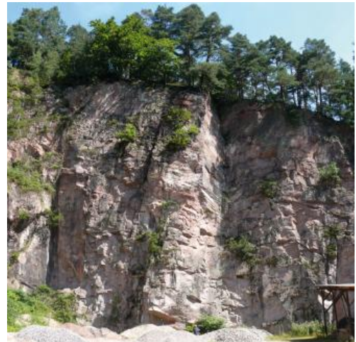
Die Steinbruchwand im Steinbruch Baden-Baden am Leisberg

Technische Eigenschaften nach Lukas (1990b):