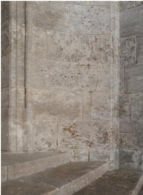
Mauer und Treppe an der Abtei Neresheim, Oberjura-Dolomit

Wegen des großen Angebots an Naturwerksteinblöcken und Fertigprodukten aus anderen Regionen, besonders der benachbarten Fränkischen Alb, spielt die Nutzung des Oberjura-Kalksteins der Schwäbischen Alb für den Naturwerksteinbereich seit gut 30 Jahren nur noch eine geringe Rolle. Bedeutsam sind heute besonders Weißjura-Kalksteine für die Erzeugung von Körnungen für den Verkehrswegebau sowie zur Herstellung von Bindemitteln. Das Potenzial des Weißjuras ist allerdings für Werksteine groß. Vor allem massige, oft fossilreiche oder fossilreichtreiche helle Kalksteine sind gut polierfähig, so dass das Gebiet der Schwäbischen Alb, dort wo die tektonische Beanspruchung gering ist, grundsätzlich ein Vorratsgebiet für sog. Industriemarmore darstellt.