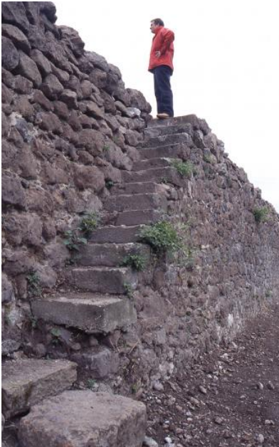
Weinbergsmauer bei Achkarren

Vulkanische Tuffsteine wurden im Kaiserstuhl und seiner Umgebung vor allem dort in beachtlichem Umfang verwendet, wo großformatige Werkstücke für den Bau benötigt wurden. „Tephrit-Pyroklastite waren in sakralen und weltlichen Bauten des Mittelalters das bevorzugte Material regelmäßig geformter Quader, Tür- und Fensterrahmen“ (Wimmenauer, 2009a, S. 129). Beste Beispiele sind das Breisacher St. Stephansmünster und die Tore, Türme und großen Wehrmauern der alten Reichsstadt Breisach. Auch für die Kirchen in Niederrotweil und Burkheim sowie für viele profane Bauten in den Kaiserstühler Orten wurde Tephrit eingesetzt. Selbst für mittelalterliche Kanonenkugeln, für im 18. Jh. bis nach Straßburg gehandelte Ofenplatten und sogar für ornamentierte Taufsteine griff man auf Tephrit-Pyroklastite zurück (Wimmenauer, 2009a, b). Wie eingangs erwähnt, sind die vulkanischen Tuffsteine das Hauptbaumaterial für die Weinbergsmauern in den ausgedehnten Weinlagen des Kaiserstuhls.