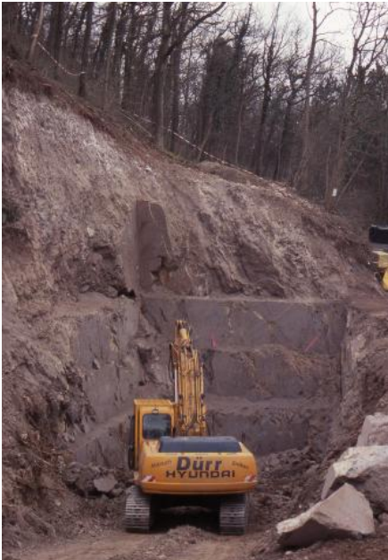
Tuffsteinabbau am Achkarrener Schlossberg

Phase 4: Probeabbau: Im November 2003 wurde vom zuständigen Landratsamt ein Probeabbau genehmigt, der Mitte Dezember 2003 begonnen wurde. Nach Beseitigung von Boden und Hangschutt mit einem schweren Bagger konnte ein etwa 10 x 20 m großer Bereich mit geeignet erscheinendem Gesteinsmaterial festgestellt werden, andere Bereiche im freigelegten Bereich schieden aus. Großproben für gesteinsphysikalische Untersuchungen und für die versuchsweise Bearbeitung durch einen Steinmetzbetrieb wurden entnommen. Danach wurde vom LGRB eine rohstoffgeologische Beurteilung des viertägigen Probeabbaus am Achkarrener Schlossberg vorgelegt, in dem auch die günstigste Abbaumethode empfohlen wurde.