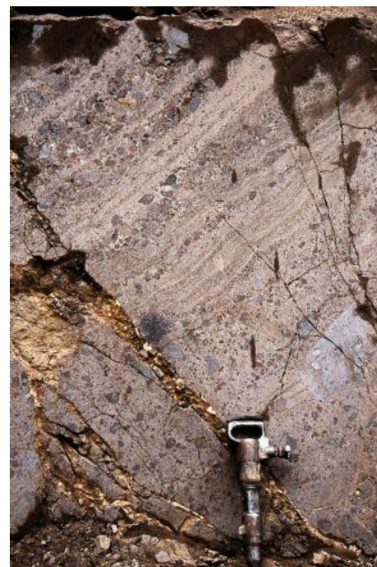
Tephrit-Pyroklastit vom Achkarrener Schlossberg im westlichen Kaiserstuhl

Zusätzlich wurden zahlreiche Großproben am LGRB mit Gesteinssägen in Quader und Platten gesägt, um die Verbandsfestigkeit an größeren Probenmengen mit kostengünstigen Methoden zu testen. Dünnschliffuntersuchungen zeigten ergänzend, dass die Kornbindung der vulkanischen Bruchstücke (Asche, Tephra) ebenso gut war wie in Vergleichsstücken von intakten Blöcken aus dem Mauerwerk des Münsters. In einem LGRB-Gutachten wurden die Ergebnisse zusammengefasst und empfohlen, im nächsten Schritt einen Probeabbau durchzuführen, um vor allem die Dichte von Trennflächen an einem frischen Aufschluss bestimmen und erste frische Probelöcke entnehmen zu können.