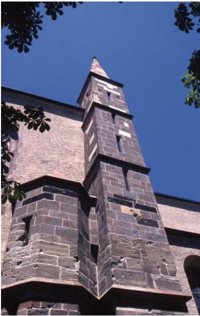
Treppenturm des Breisacher Münsters