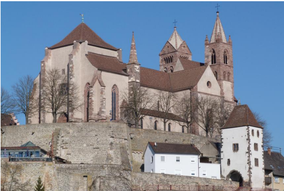
Das Breisacher St. Stephansmünster

Das Breisacher St. Stephans Münster, eine bedeutende spätromanische bis gotische Basilika, wurde zum einen aus grobem Tephrit-Pyroklastit des Kaiserstuhls und zum anderen aus Buntsandstein vom Hochrhein erbaut. Während der Renovierungsphase nach dem Zweiten Weltkrieg wurde auch Roter Mainsandstein verwendet. Sandstein und Tephrit-Pyroklastit wurden in der Zeit zwischen 1185 und 1490 oft in blockweisem Wechsel eingebaut. Der Kaiserstühler Tuffstein wurde im Mittelalter aus verschiedenen Steinbrüchen bei Breisach und vom westlichen Kaiserstuhl auf dem Landweg, der Buntsandstein aus dem Gebiet Degerfelden–Schopfheim (südliches Markgräflerland und Hochrhein, vgl. Südschwarzwälder Buntsandstein) mit Rheinschiffen herangeschafft (Werner, 2008).