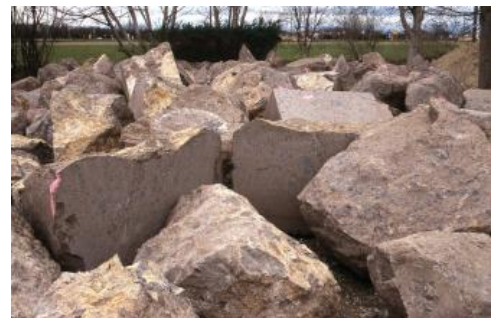
Rohblöcke aus Kaiserstühler Tuffstein im Lager bei Breisach

Die bearbeitungsfähigen Blöcke von 0,5 bis ca. 2,5 m 3 Größe wurden in ein Zwischenlager gebracht. Die zu kleinen oder für die Bearbeitung ungeeigneten Blöcke wurden separat gelagert und später zur Reparatur von Weinbergsmauern im Rahmen der von der Naturschutzbehörde gewünschten Ausgleichsmaßnahme sowie zur Teilverfüllung der Entnahmestelle verwendet. Ein Abschnitt der Abbauwand blieb als Geotop erhalten. Es ist nicht auszuschließen, dass das Vorkommen zu einem späteren Zeitpunkt auch für andere Renovierungsmaßnahmen an historischer Bausubstanz wieder genutzt wird, zumal aufwändige Voruntersuchungen nicht mehr nötig wären.