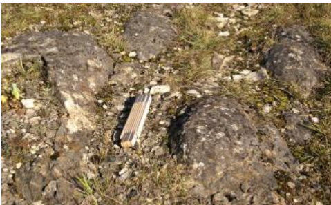
Kuppel- bis wulstförmige Bakterienlaminite, sog. Stromatolithe, am Top des Hardheimer Muschelkalks im früheren Steinbruch am Wurmberg

Die Kalksteine des Hardheimer Muschelkalks sind marine Sedimente des flachsten Subtidals. Die Oolithe und Schillkalksteine wurden im turbulenten, nur wenige Meter tiefen Wasser abgelagert. Auch die, vorwiegend am Top des Hardheimer Muschelkalks auftretenden, an die durchleuchtete Wasserzone gebundenen Bakterienlaminite (Stromatolithe) sind ein Anzeichen für einen flachmarinen Bildungsraum (Vollrath, 1923; Günzburger, 1936; Hagdorn & Simon, 1993b, 2005b). Die gelegentlich lagenweise vorkommenden Kalksteingerölle weisen auf Stürme hin, bei denen der bereits schwach verfestigte Kalkschlamm am Meeresboden erodiert und umgelagert wurde. Der schnelle vertikale und laterale Wechsel der o. g. Gesteinstypen (Vollrath, 1923; Barg, 1933) belegt einen kleinräumig gegliederten Bildungsraum. Anzeichen für ein kurzfristiges