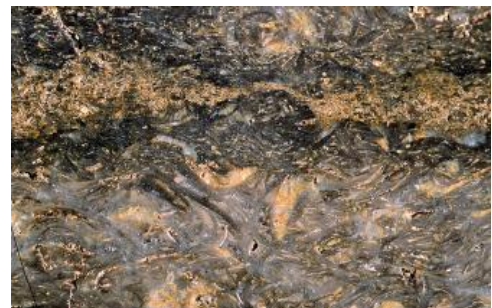
Typische Ausbildung des Krensheimer Quaderkalks als dicht gepackter Bruchschillkalkstein

Die Quaderkalksteine bestehen aus dickbankigen, oft deutlich schräggeschichteten Schillkalksteinen. Die dicht gepackten Hauptbestandteile sind zerbrochene Muschel- und Brachiopodenschalen. Das Gefüge ist komponentengestützt mit Lang- und Punktkontakten. Die Schalenbruchstücke sind meist mit Kalzit umkrustet. Bis mehrere cm lange Intraklasten aus feinkörnigem Kalkschlamm und Ooide treten auf, Mikrit (feinkörniger Kalkschlamm) fehlt meistens. Das Bindemittel besteht überwiegend aus sparitischem Zement, z. T. auch aus Mikrospart. Das Gestein ist stark porös, was auf nicht zementierte oder durch Lösung entstandene Hohlräume im Bruchschill zurückzuführen ist. Die Poren sind gelegentlich mit rostbraunem Eisenoxidhydrat ganz oder auch nur teilweise gefüllt, was dem ansonsten hellgrauen Gestein eine rötlich braune Farbe verleiht.