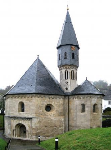
St. Achatius-Kapelle in Grünsfeldhausen, erbaut aus Krensheimer Quaderkalk

Die Zahl der über die Jahrhunderte betriebenen Steinbrüche im Quaderkalksteinrevier geht in die Hunderte. Damit zählt es weltweit zu den Regionen mit der größten Steinbruchdichte (Rutte, 1957). Schon vor etwa 800 Jahren wurden in der Grünsfeld–Krensheimer-Gegend Quaderkalk abgebaut, wie die Bau- und Ornamentsteine an der St. Achatius-Kapelle (1180–1210) in Grünsfeldhausen oder an Teilen des Grünsfelder Schlosses und der Stadtmauer zeigen (Weiss, 1992). Auch in den späteren Jahrhunderten wurde Quaderkalk für Sakralbauten und öffentliche Bauten benutzt (z. B. Kirche St. Peter und Paul, 14. Jahrhundert, und Rathaus von Grünsfeld, 16. Jahrhundert). Im 16. Jahrhundert waren Steinmetze schon eine bedeutende Gruppe in der Handwerkerschaft von Grünsfeld. Bis nach Würzburg wurden Steine geliefert, z. B. für die berühmte Mainbrücke. Die Verwendung als Baustein war zwar bis zum Ende des 19. Jahrhunderts vorwiegend auf die nähere Umgebung beschränkt, doch bereits nach dem Dreißigjährigen Krieg wurden aus dem Maingebiet, besonders aus Randersacker, Guss- und Abtrittsteine bis nach Holland verschifft (Haas, 2002).