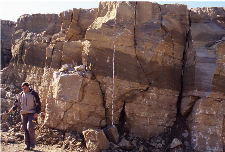
Mittel- und dickbankige Schillkalksteine; Krensheimer Quaderkalk, Steinbruch Grünsfeld-Krensheim

Von herausragender Bedeutung sind die Werksteine der Quaderkalkfazies, die in Württembergisch Franken und in Mainfranken im obersten Teil der Meißner-Formation auftreten (Oberer Muschelkalk, Quaderkalk-Formation). Quaderkalk ist ein von Steinbrechern eingeführter Begriff, der aus der Gegend Krensheim–Kirchheim–Ochsenfurt stammt. Er bezeichnet dickbankige, bioklastische Kalksteine mit einem typischen, meist rechtwinklig verlaufenden Klufnetz, das annähernd quaderförmige Blöcke liefert. Maßgebend für den langen und andauernden wirtschaftlichen Erfolg der Quaderkalksteine sind die mehrere Kubikmeter großen Blöcke („Quader“), die infolge des weitständigen, senkrecht aufeinanderstehenden Klufnetzes gewonnen werden können, die guten gesteintechnischen Eigenschaften sowie die geringen Abraummächtigkeiten, die einen kostengünstigen Steinbruchbetrieb erlauben.